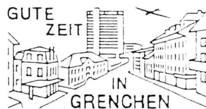
Abb. 178 Ortswerbeflagge (Bildstempel) für das Postamt I in Grenchen, verliehen am 22.10.1979. Darstellung der gleichen Örtlichkeit wie in Abb. 177. Historischer Gasthof Löwen (1838) sowie Hochhaus am Marktplatz und Flugzeug. Vgl. Abb. 177.