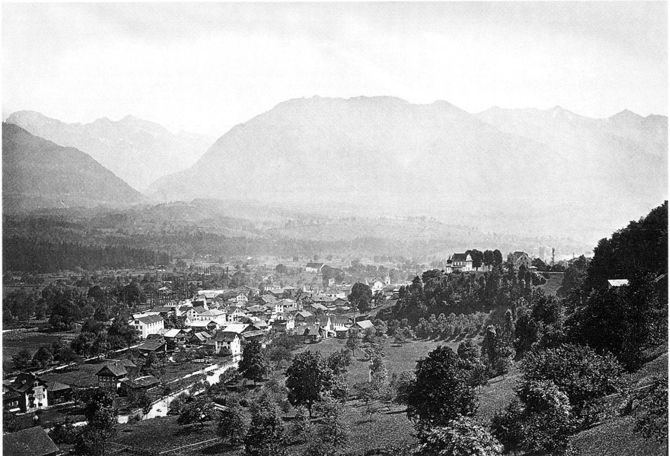
Abb. 77 Der Flecken mit dem Burghügel Landenberg um 1875. Eine der ältesten Fotografien des Obwaldner Hauptortes.