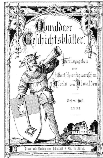
Abb. 79 Obwaldner Geschichtsblätter, 1. Heft 1901 (Titelblatt). Hg. vom historisch-antiquarischen Verein Obwalden.