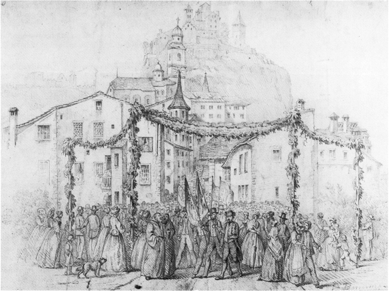
Fig. 3 Rassemblement pour les concerts organisés à l'occasion de l'assemblée de la Société helvétique de musique en juillet 1854. Xylographie publiée dans la Suisse illustrée , 1854.

1859 Construction de la maison Solioz à la rue de Lausanne No 21.