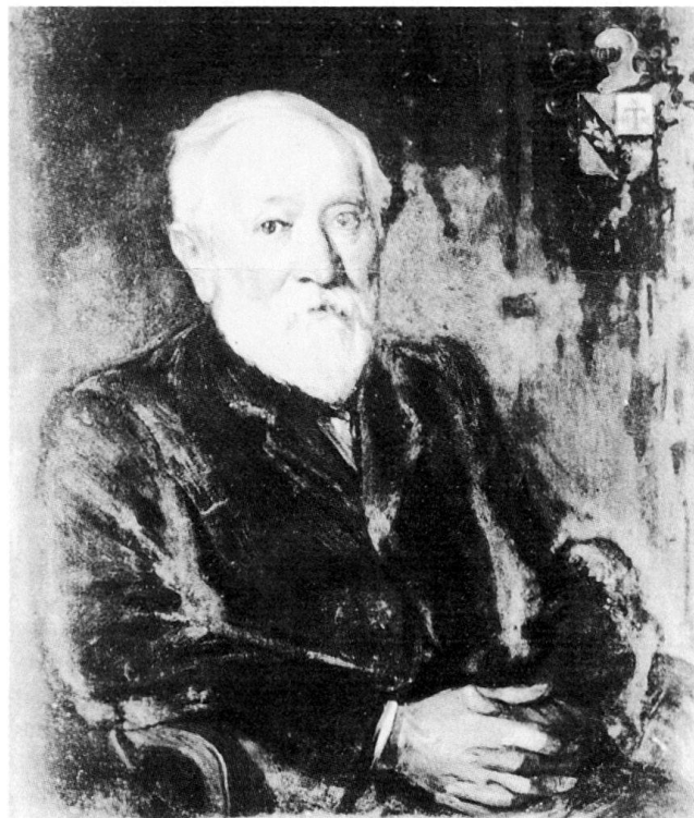
Fig. 13 Portrait de Joseph de Kalbermatten par le peintre Joseph Morand en 1918.