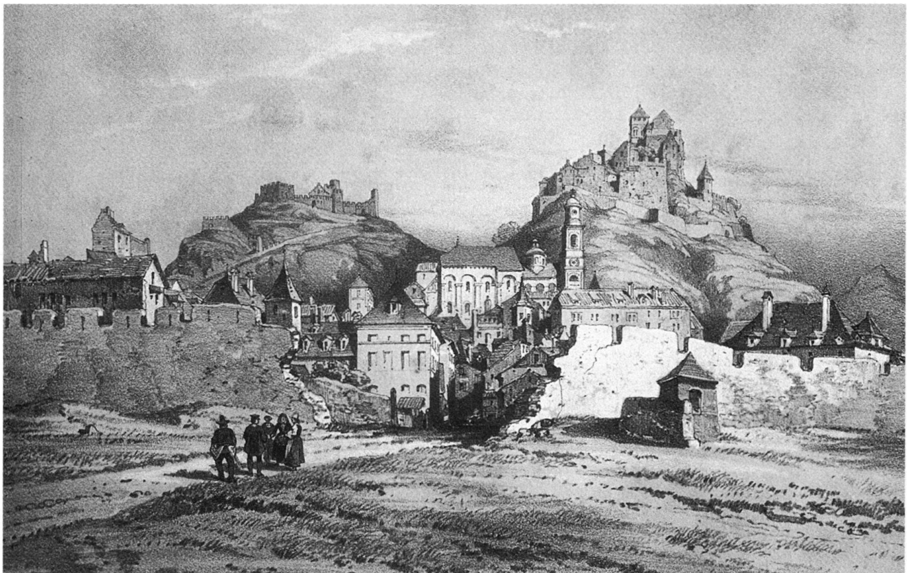
Fig. 2 Les fortifications occidentales de la ville de Sion peu après le démantèlement de la porte de Conthey. Lithographie de Théodore Du Moncel, 1838.

1843 Projets pour un Hôtel national (Palais du Gouvernement) par l'architecte veveysan Philippe Franel et l'ancien père jésuite Etienne Elaerts. Voir 1848.