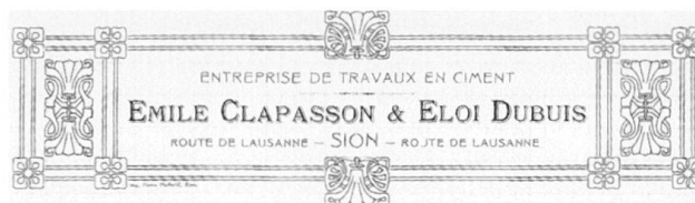
Fig. 16 En-tête de lettre de l'entreprise Clapasson et Dubuis en 1919.