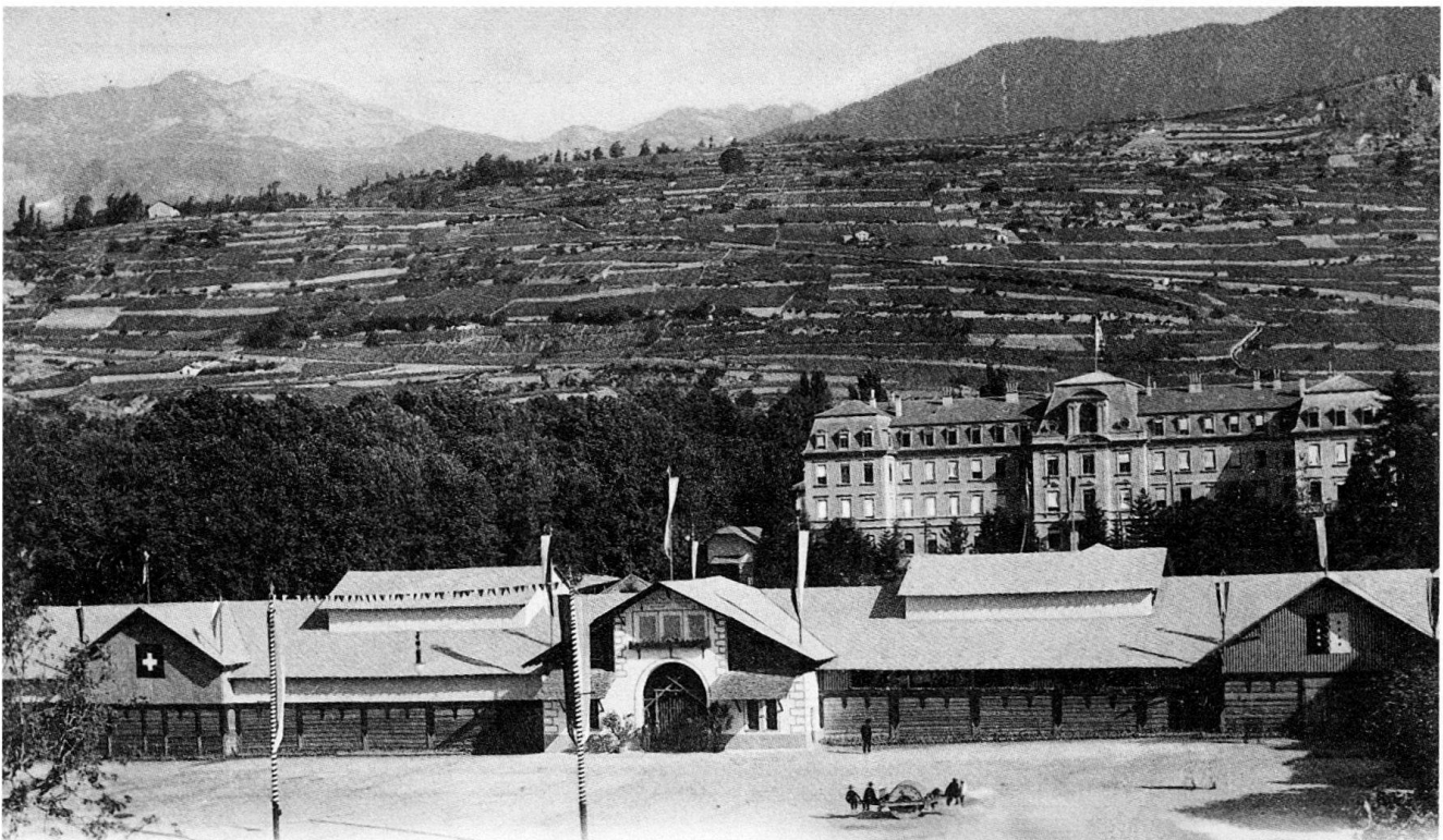
Fig. 7 Pavillons de l'Exposition cantonale de 1909 au nord de la place de la Planta.

1908 Edition du Village dans la montagne de Charles-Ferdinand Ramuz avec des illustrations du peintre Edmond Bille.