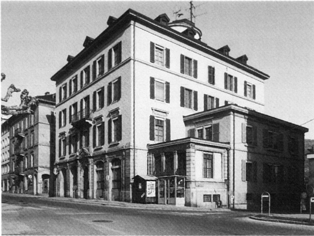
Fig. 4 L'hôtel de Philippe de Torrenté construit en 1866.

1866 28 juin: nomination d'une commission formée de conseillers municipaux et bourgeois pour étudier la création d'une buanderie et d'un établissement de bains municipaux. Sans suite. Voir 1898.