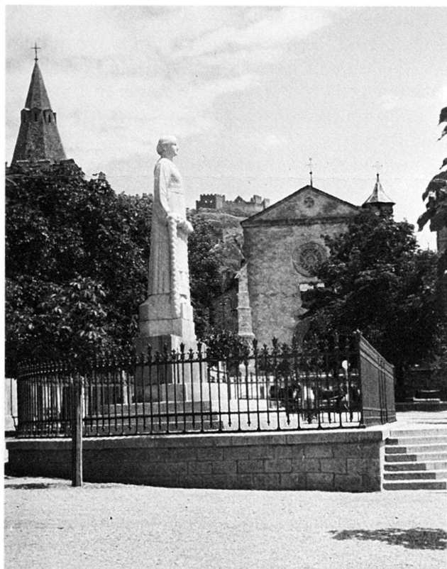
Fig. 9 Monument commémoratif sculpté par James Vibert et installé en 1919 sur la place de la Planta.

1915–1918 Construction de l'école des filles à l' avenue de la Gare No 45. Voir 1898.