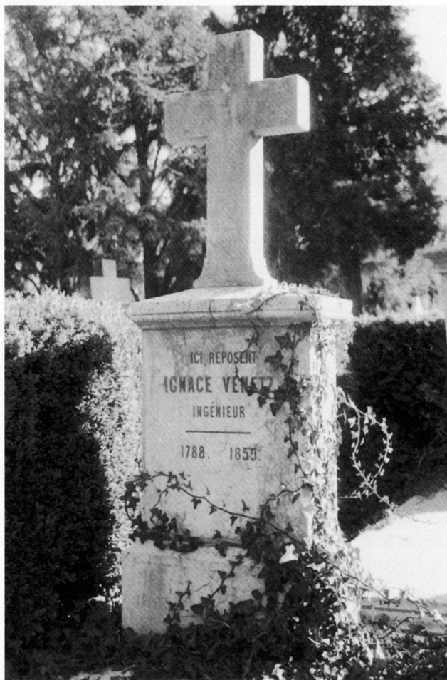
Fig. 12 Tombe de l'ingénieur Ignace Venetz dans l'ancien cimetière de Sion.