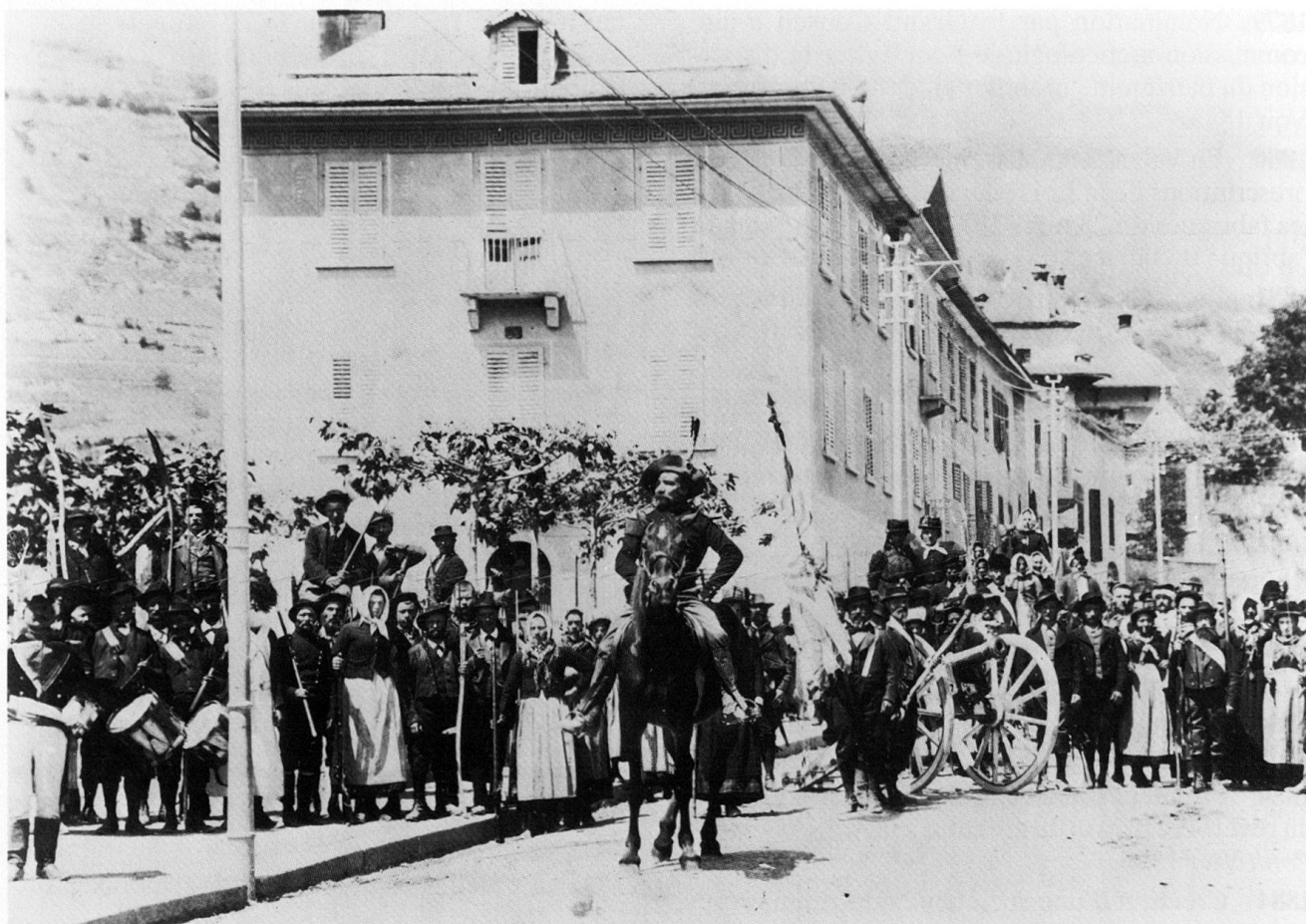
Fig. 5 Cortège historique de 1899 à la rue de Loèche.

1898 5 décembre: décision de dresser un plan du réseau d'égouts existant en vue de son extension.