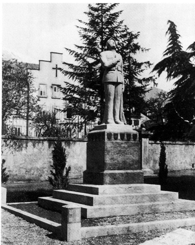
Fig. 10 Monument dédié aux soldats morts pour la patrie sculpté par Jean Casanova et installé en 1923 devant le séminaire épiscopal sur la place de la Cathédrale.

1931–1934 Construction de la rue de Gravelone .