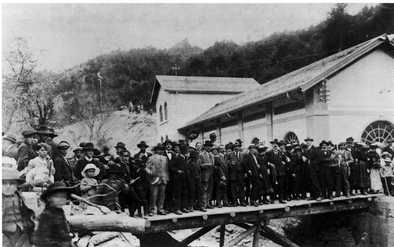
Fig. 8 Inauguration de l'usine électrique de Lienne II le 5 mai 1918.

1914–1917 Construction de l'usine électrique de Lienne II qui renforce celle du Beulet. Inauguration le 5 mai 1918.