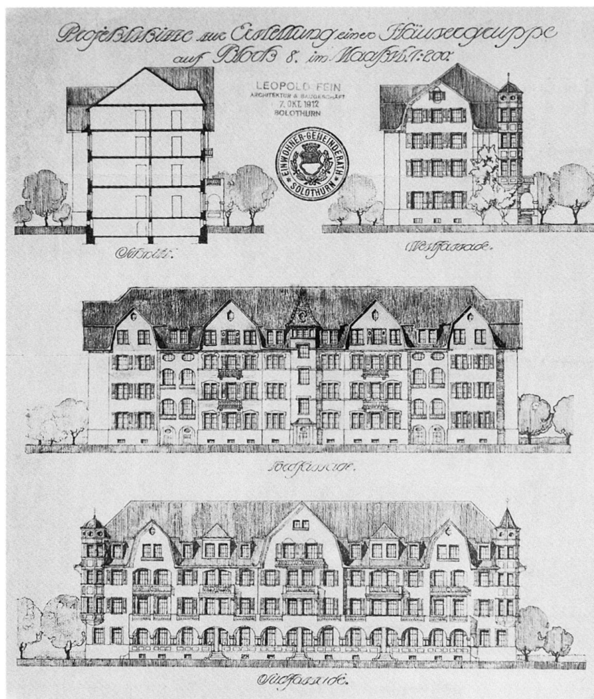
Abb. 161 Baueingabeplan von 1912 für die Heimatstilbauten Rötiquai 14–22, von Architekt Leopold Fein.

Zusammenstellung: Kantonale Denkmalpflege Solothurn, Markus Hochstrasser, Juli 2001.