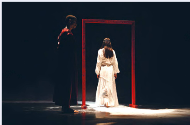
Lo sguardo che solleva, lo sguardo che precipita , 23.12.2022, Teatro Sociale di Casvegno OSC