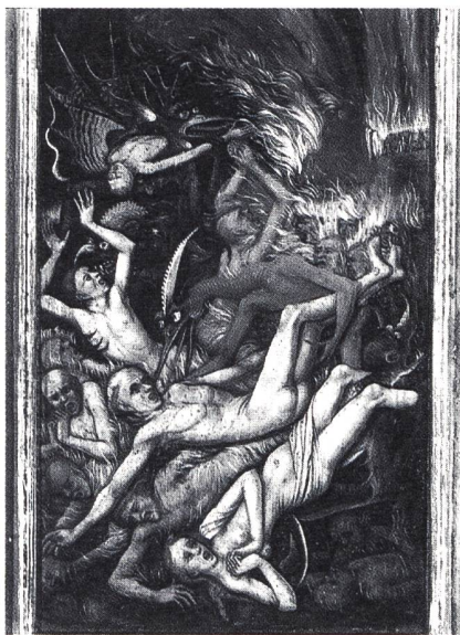
Höllenszene aus einem Weltgerichtsbild, um 1475, unbekannter Maler.