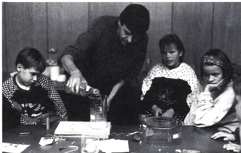
Löschmittel aus dem Küchencasten: mit Essig und Backpulver Löschgas herstellen

Neben der Fachstelle Schule & Museum mit ihrem Feuerkoffer beteiligten sich auch das Museum Rietberg und das Kunsthaus Zürich: das Museum Rietberg mit der im Frühjahr 1993 eröffneten kleinen