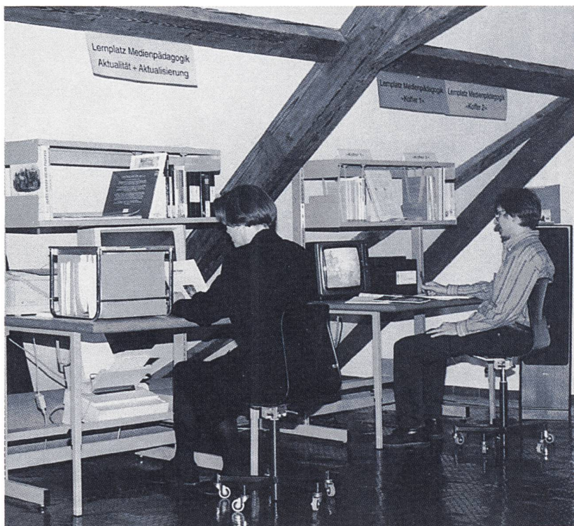
Lernplätze Medienpädagogik – «Aktualität und Aktualisierung» sowie Angebote aus «Koffer 1» und «Koffer 2»

und erproben die Spielenden nämlich auch Handlungsvarianten, die im eigenen Verhaltensrepertoire fehlen oder im Alltag gar nicht zulässig sind. Nach dem Motto «Spiel mir das Lied vom Western» (vgl. Leitfaden Medienpädagogik S. 107) gibt es aber auch im realen Leben zahlreiche Spuren, die von der Faszination des Wilden Westens zeugen: Westernbars, Zigarettenwerbung und Countrymusik.