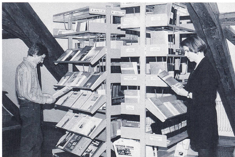
AV-Medien und ergänzende Materialien zu den Lernplätzen stehen auf den entsprechenden Rollwagen bereit

Die aufliegenden Materialien können im AV-Atelier wie in einem Lesezimmer eingesehen und genutzt werden. Die Arbeitsstation «Lernprogramme» zeigt das aktuelle Angebot an Unterrichtssoftware des Pestalozzianums und des kantonalen Lehrmittelverlags. Auf Anfrage hin können am Lernplatz «Neue Medien» schulrelevante Beispiele aus der umfangreichen Palette von CD-ROMs besichtigt werden: Lernsoftware, Datenbanken, Nachschlagewerke, wissensvermittelnde Programme und Spiele. Für Lernsoftware und CD-ROM-Anwendungen liegt ein Wegweiser in gedruckter oder elektronischer Form auf. Zahlreiche Angebote – also Bücher, Unterrichtsvorschläge, Kataloge, Videos, Computerlernprogramme – sind ausserdem über die Ausleihe der Bibliothek/Mediothek des Pestalozzianums erhältlich oder können vom hauseigenen Verlag