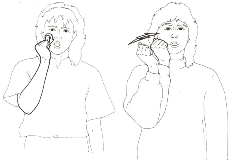
Linguistisches Minimalpaar: Die Gebärden ROT (links) und MAMA (rechts) unterscheiden sich nur durch die Komponente Bewegung – Handform, Handstellung und Ausführungsstelle sind identisch.

Zu einer ‚Imageverbesserung‘ haben sicher auch die Medien beigetragen. Gehörlosigkeit ist in den letzten Jahren vermehrt ins Bewusstsein der Hörenden gerückt. Neben wichtigen Spiel- und