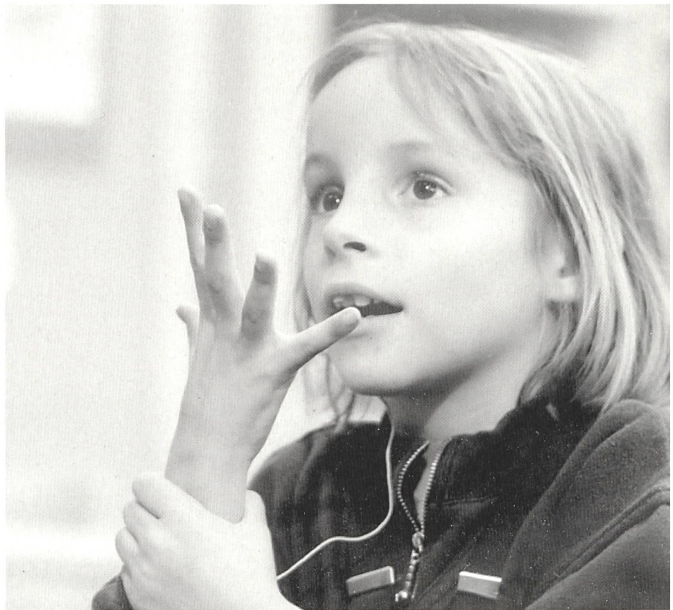
Tanz der Hände: gebärdendes Mädchen an der Genfer Gehörlosenschule «Montbrillant».

Dass Sprache nicht ausschliesslich in lautlicher Form anzutreffen und auch nicht an ein Material gebunden sei, stellt schon der sowjetrussische Sprachforscher L.S. Wygotski in seinem 1934 erschienenen Werk Denken und Sprechen fest, und er verweist in diesem Zusammenhang auf die «optische Sprache» der