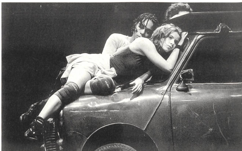
Die Gruppe Hush Hush Hush aus Belgien mit dem Stück Carte Blanche.

Das detaillierte Programm wurde im Januar an alle Schulhäuser im Kanton Zürich verschickt. Es kann unter Tel. 01/368 26 13 (Pestalozzianum Zürich, Fachstelle schule & theater) angefordert werden; auf dieser Nummer werden auch Reservationen entgegengenommen.