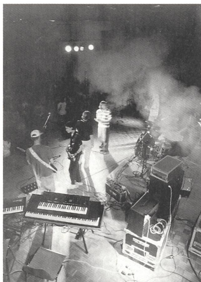
Profi-Ambience für junge Amateure: Das Band it-Openair sorgt für gute Stimmung auf dem Zürcher Platzspitz.

Bis zum 27. Juni noch ist an den regionalen Band it-Anlässen zu hören, wie Brit-Pop aus Bauma, Grunge aus dem Säuliamt oder Trip-Hop aus Opfikon klingt. Krönender Abschluss des Festivals ist das grosse Openair auf dem Zürcher Platzspitz. Am Samstag, 11. Juli steigen dann sieben von der Fachjury ausge-