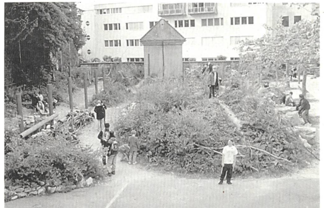
Pausenplatz Hermesbühschulhaus Solothurn, vor und nach der Umgestaltung. Foto Alex Oberholzer 1 .

me (OECD, EU, UNESCO, usw.) für die Schulen propagieren, bleibt der Einfluss solcher Verpflichtungen und Angebote auf unsere Schulen und Bildungspolitik marginal. Das hängt einerseits mit der Kantonshoheit im Schulwesen und dem traditionellen «Anti-Bundes-Reflex» der EDK zusammen, andererseits zeigt das BAG-EDK-Rahmenprogramm «Schulen und Gesundheit» (vgl. Themenschwerpunkt), dass mit einer starken Lobby und geschicktem Vorgehen geeignete Kooperationsformen gefunden werden können.