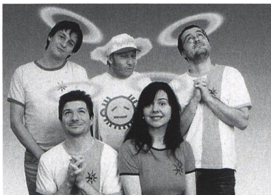
*5i – Schtärnefoifi.

Die musikalischen Lieblinge von Pausenplatz und Kinderzimmer präsentieren ihr neues Programm. Sie erzählen witzige Abenteuergeschichten und durchleuchten den Kinderalltag.