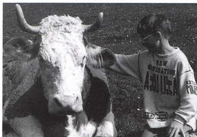
Per Du mit der Kuh! Lernerlebnis «SchuB».

Neu: SchuB auch auf dem Internet: www.schub.ch