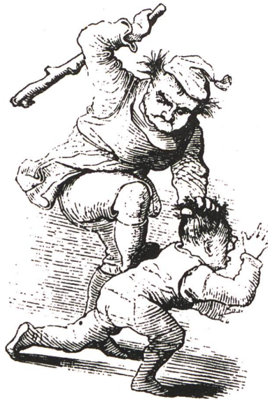
„Ich will doch sehen, ob ich dem verfluchten Buben keine Zuneigung zu mir beibringen kann.“ (Karikatur aus der Mitte des 19. Jahrhunderts)

• Gewalt ist immer – zumindest potentiell – vorhanden. Alle Massnahmen gegen Gewalt haben daher prinzipiell Feuerwehrcharakter, d.h. sie beginnen immer erst, «wenn es schon brennt». In diesem Sinne gibt es auch keine eigentliche Ge-