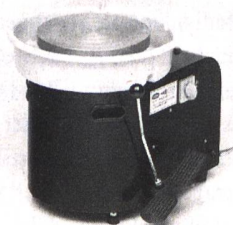
Töpferscheibe SSB 2 Töpferscheibe mit Ringkonus Fr. 1190.– inkl. Mwst