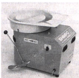
Töpferscheibe SHIMPO LP Die kompakte Töpferscheibe Fr. 1485.– inkl. Mwst