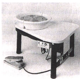
Töpfermaschine MICHEL E400 Die elegante Töpfermaschine Fr. 1790.– inkl. Mwst