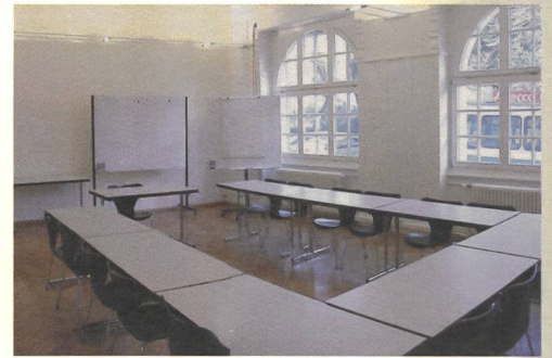
■ Eine Kursgruppe der Intensivweiterbildung an ihrem Planungstag ■