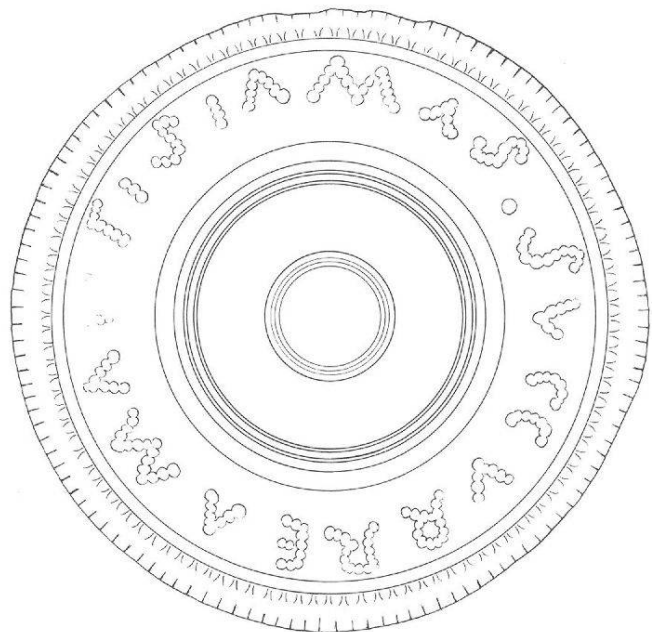
Abb. 2 Fibel mit Inschrift aus Tongeren (Limburg). M. 1:1. Umzeichnung nach L'Antiquité Classique 30, 1961, Taf. 4,2.