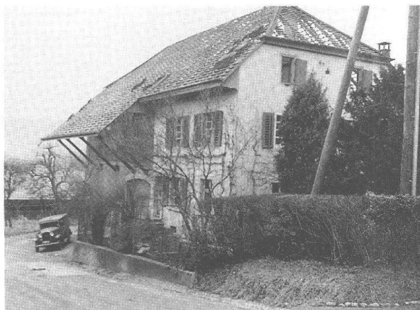
Abb. 1 Süd- und Westfassade des ehemaligen Bauernhofes Frey-Bohny an der Giebenacherstrasse, kurz vor dem Abbruch im Januar 1952. Die Dachziegel sind schon entfernt.