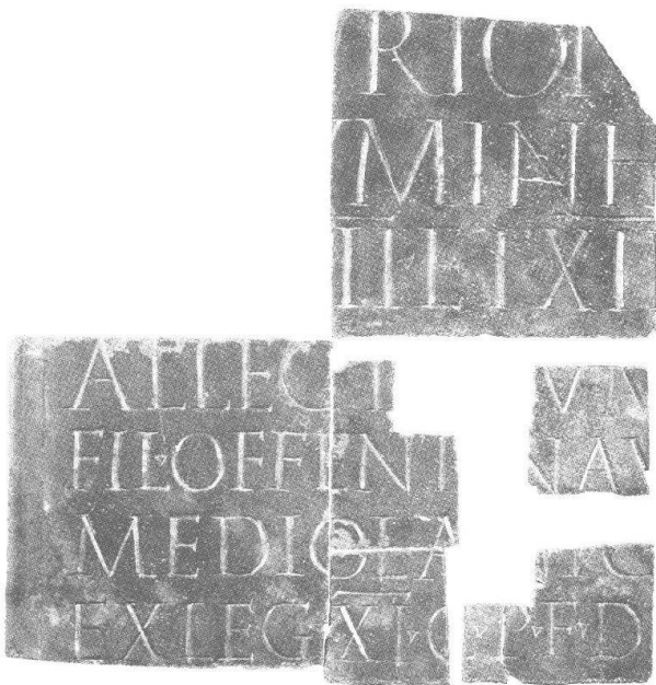
Abb. 2 Bronzetäfelchen von Wutöschingen (BRD); HM 333. Ohne M.

Beim Fund von Wutöschingen (Kr. Waldshut, BRD; Abb. 2) handelt es sich um ein nur fragmentarisch überliefertes Täfelchen, das ein aus Mediolanum stammender Soldat der legio XI Claudia anfertigen