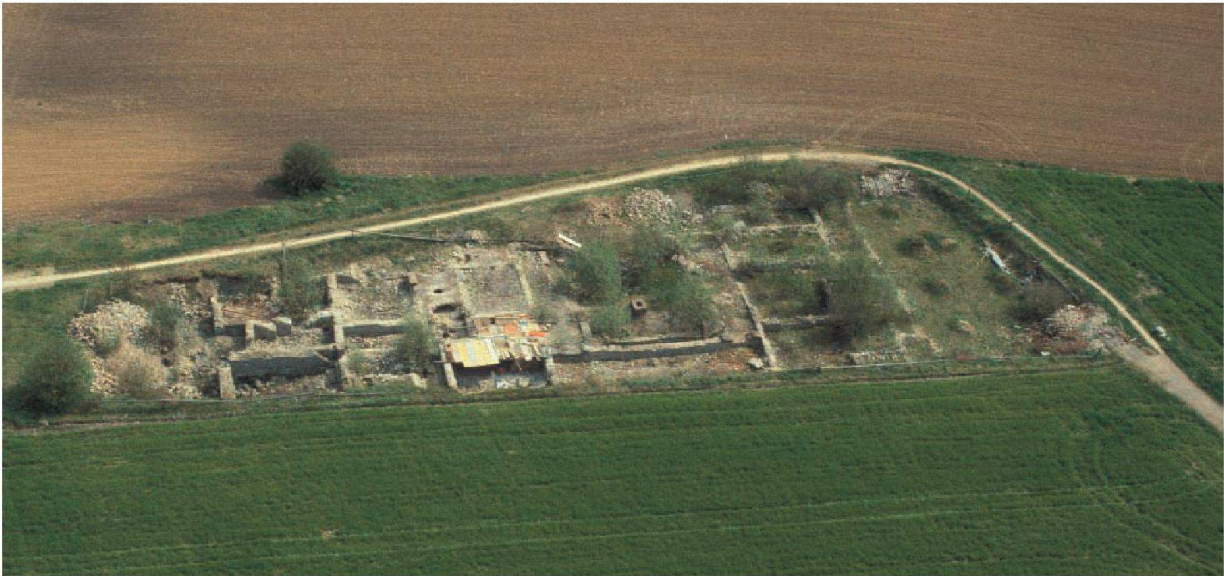
Abb. 1: Augst, Augusta Raurica, Insulae 41/47. Nie mehr sollen freigelegte und mit Begeisterung gefeierte Ausgrabungsbefunde in Augusta Raurica dermassen «ruiniert» werden! Im Süden der römischen Stadt hätte in den 1970er Jahren eine neue Kantonsstrasse Richtung Pratteln-Längi entstehen sollen. Die Strassenbauarbeiten haben im antiken Stadtperimeter eine archäologische Notgrabung ausgelöst. Sie führte 1972/73 in den Insulae 41/47 zur Entdeckung des berühmten «Palazzos» mit elf Mosaikfussböden. Diesen Luxusbau des frühen 3. Jahrhunderts wollte man begrifflicherweise der Nachwelt erhalten und den Römerstadtgästen konserviert zugänglich machen – genauso wie heute die Entdeckungen in der Insula 27. Man hob die Mosaiken und liess die Villenruine offen liegen in der Hoffnung, die in den Medien landesweit verbreiteten Entdeckungen könnten bald geschützt und öffentlich zugänglich gemacht werden. Die Bestrebungen der damals Verantwortlichen zur Konservierung und Erschliessung des Komplexes zogen sich jedoch über Jahre hin, während die ungeschützt der Witterung ausgesetzten Baureste langsam überwucherten und allmählich zerfielen (Bild). Trauriges Fazit zehn Jahre nach der Entdeckung: Die Kantonsstrasse wurde nicht gebaut, das Monument konnte aber auch nicht konserviert werden. Aus Nachlässigkeit erlitt es grosse Schäden durch fortgeschrittenen Zerfall und wurde 1982 – viel zu spät – mit Erde wieder zugeschüttet.