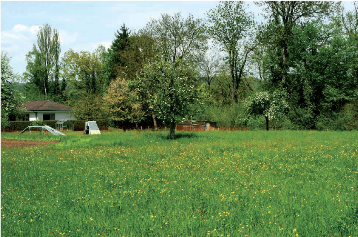
Abb. 9: Augst, Augusta Raurica, Insula 27. Die Grabungsfläche von 2004/05 im Frühjahr 2006, ein Jahr nach dem regierungsrätlichen Grabungsstopp. Die schichtweise Wiederschüttung mit Sand, Aushubmaterial und Humus führte zu einer kaum wahrnehmbaren Erhebung. Bis zur erneuten Freilegung werden nun einige Jahre verstreichen, während deren das Areal – wie vor der Ausgrabung – als Wiesland genutzt werden kann. Wenn in einigen (hoffentlich wenigen) Jahren die didaktischen und architektonischen Konzepte für eine Präsentation der wieder im Boden schlummernden römischen Stadtvilla vorliegen und der politische Souverän die Kosten der Konservierung und des Schutzbaus bewilligt, kann hier eine der attraktivsten Sehenswürdigkeiten der Römerstadt Augusta Raurica entstehen.