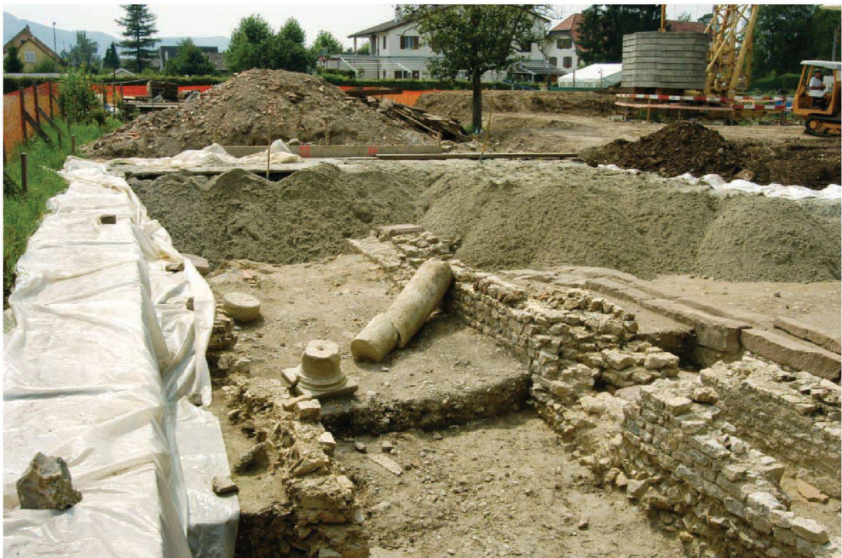
Abb. 7: Augst, Augusta Raurica, Insula 27, Grabung 2005.054. Grosse Teile der antiken Stadtvilla sind im Bild bereits mit Feinsand zugeschüttet (hinten), aber diese Partie in der östlichen Innenportikus mit umgekippter Säule blieb bis zuletzt offen: Sie gab am 10.08.2005 eine gute Kulisse an unserer Medienorientierung ab für die «letzte Sand-Charge» (Abb. 8).