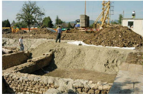
Abb. 4 und 5: Augst, Augusta Raurica, Insula 27, Grabung 2005.054. Die Ausgrabung während des Wiedereinfüllens. Um die Ruine bis zu ihrer definitiven öffentlichen Präsentation gegen weiteren Zerfall zu schützen, wurde das ganze Grabungsareal der freigelegten Stadtvilla in der Insula 27 mit feinem Sand zugeschüttet. Über den bereits mit Sand verfüllten Teilen der Ausgrabung wird ein Geovlies (weiss) verlegt. Darauf verteilt ein Bagger Grabungsaushub. Im Vordergrund (links) ein Teil des Innenhofes der Peristylvilla mit dem Wasserbecken. Das aus Ziegeln und Lehm konstruierte, fragile Becken ist hier noch durch eine Holzabdeckung geschützt, die vor dem Einfüllen mit Sand entfernt wird. Heute wächst wieder Gras über der römischen Villa (Abb. 9).