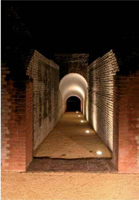
Abb. 5: Augst, Theatersanierung (Grabung 2006.055). Monumentenbeleuchtung. Blick von der Peripherie durch das so genannte Südost-Vomitorium.

Einbau des Bühnenbodens beauftragte Holzbaufirma K. Graf, Maisprach 7 , empfohlen wurde, mussten auf der Oberfläche der Bühne kaum Schrauben verwendet werden. Es entstand so einerseits eine optisch sehr ruhig erscheinende Bodenfläche, andererseits sorgt das Montagesystem auch für eine verbesserte Haltbarkeit der Eichenbretter. Weil die Dornen der Befestigung seitlich in die Bretter hineingedrückt werden, dringt weniger Regenwasser in die Hölzer ein und die Lebensdauer des Bodenbelags wird deutlich verlängert (Abb. 8; 9).