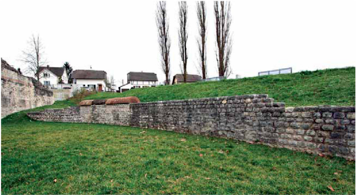
Abb. 14: Augst, Theatersanierung (Grabung 2006.055). Südwestliche Podiumsmauer des Amphitheaters, Übersicht über die fertig sanierte Mauerpartie.

denen Hohlräume wurde eine fein geschlämte Kalkemulsion 20 eingebracht und die antiken Verputzkanten wurden anschliessend mit Restauriermörtel angebördelt. Das optische Erscheinungsbild der Podiumsmauer wird durch diese Sicherungsmassnahmen kaum beeinflusst. Die Feinsanierung dieser wichtigen Mauerpartie ist damit abgeschlossen (Abb. 14).