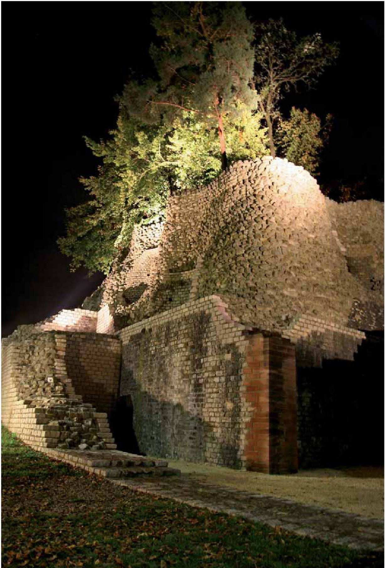
Abb. 7: Augst, Theatersanierung (Grabung 2006.055). Monumentenbeleuchtung, Eingang zum Mittelvomitorium. Von unsichtbaren Scheinwerfern angestrahlt, recken sich Mauerwerk und Baumbestand effektiv zum Himmel.