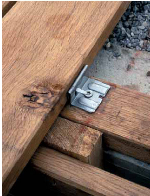
Abb. 9: Augst, Theatersanierung (Grabung 2006.055). Einbau des Bühnenbodens aus Eichenbrettern: Die Domen des Montagesystems «Igel» werden seitlich in das nachfolgende Bodenbrett gedrückt, dadurch dringt weniger Regenwasser in die Hölzer ein und die Lebensdauer des Bodens wird verlängert.