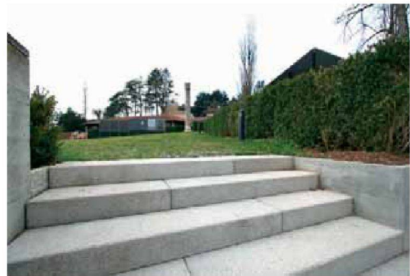
Abb. 4: Augst, Theatersanierung (Grabung 2006.055). Der neu gestaltete Versammlungsplatz im nordwestlichen Theater-Vorfeld.

Parallel zur Anlage der Schotterrasenwege wurde die Elektrifizierung des gesamten Monumentes abgeschlossen.