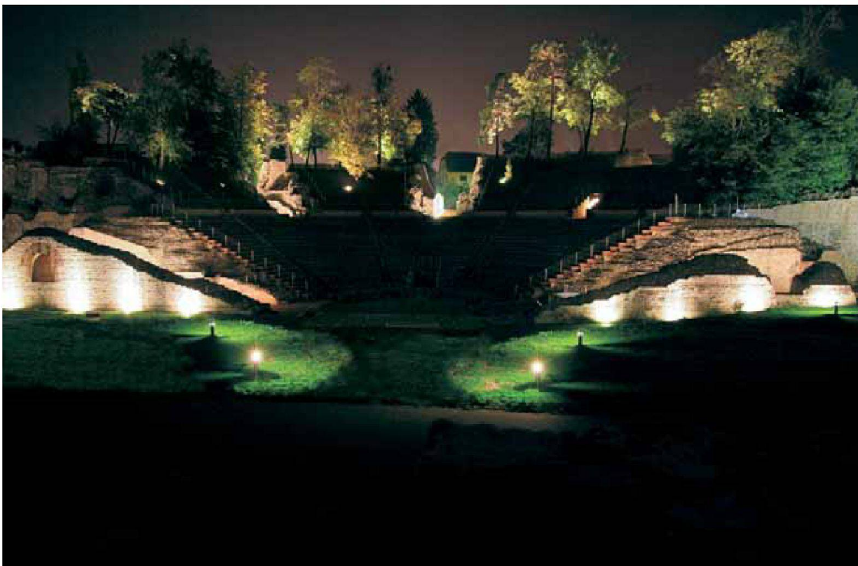
Abb. 6: Augst, Theatersanierung (Grabung 2006.055). Monumentenbeleuchtung. Vom Schönbühltempel aus gesehen bietet das beleuchtete Theater einen imposanten Anblick.