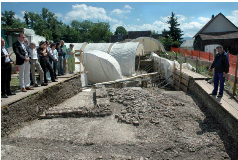
Abb. 3: Ebenfalls am 12. Mai war die laufende Grabung auf der Augster Obermühle zu besichtigen. Grabungsleiter Markus Spring (rechts) erklärt die komplexen Befunde auf einer freigelegten Strassenkreuzung: Wie bei unseren heutigen Strassen erstreckte sich hier schon vor 1800 Jahren ein dichtes Netz von unterirdisch verlegten Teuchel-Frischwasserleitungen und Abwasserkanälen. Karrenspuren auf der Oberfläche der Schotter-schichten und Reste eines Laufbrunnens ergänzten das urbanistisch äusserst interessante Bild.

senden Rettungsgrabung im Dorfkern von Kaiseraugst bekannt (Abb. 4). Der anschliessende traditionelle Apéro konnte bei strahlendem Wetter im Garten des Restaurants «Adler» serviert werden und stiess wie gewohnt auf grosse Resonanz.