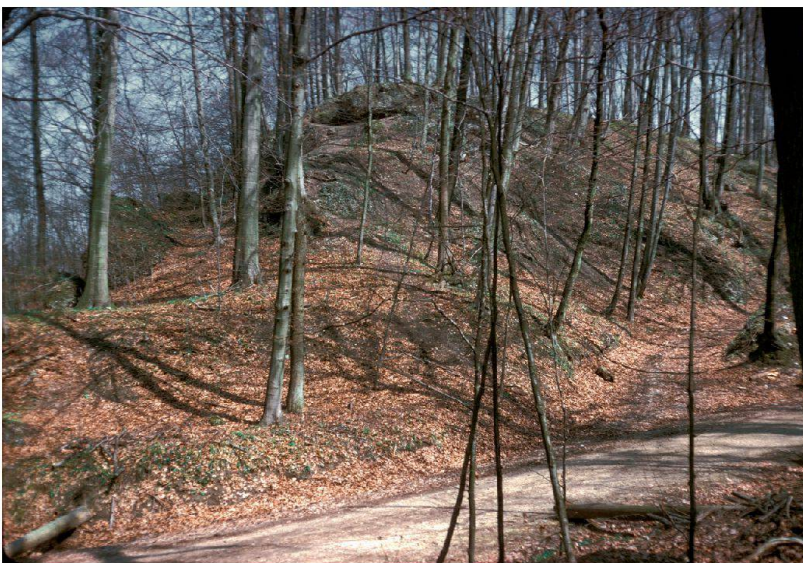
◀ Abb. 4: Die Flühweghalde ist ein markanter, heute bewaldeter Hügelsporn 2 km ost-südöstlich von Kaiseraugst. Oben auf dem schmalen Plateau wurden 1933 Reste eines gallorömischen Vierecktempels freigelegt (Abb. 6). Wahrscheinlich war hier eine Art Wallfahrtsort für die Bevölkerung der Colonia Raurica. Die Herbst-Exkursion führte auf den Hügel, wo nur Kalkbruchsteine und Ziegelreste, aber keine Ruinen zu sehen sind (Abb. 5).