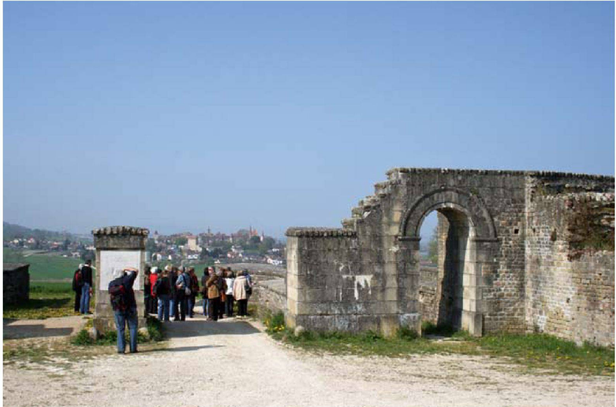
Abb. 1: Die Frühjahrsexkursion führte die Gönnerinnen und Gönner der Stiftung Pro Augusta Raurica am 24.04.2010 zuerst nach Avenches/VD (Bild: Stadtmauer mit Osttor «la Tornallaz») und anschliessend in die römische Villa von Vallon/FR.