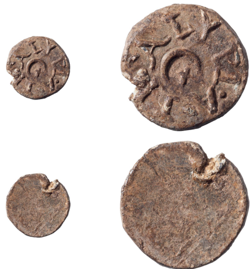
Abb. 2: Vorder- und Rückseite der Bleiplombe 1 (Inv. 1997.060.D08300.4). Links: M. 1:1, rechts: M. 2:1.

Anmerkungen: Die lateinische Inschrift gibt den Namen des A(ulus) Ti(-) Alypus im Genitiv wieder, der als römischer Bürger in seinem Besitz befindliche Waren mittels der vorliegenden Bleiplombe kennzeichnen liess. Das praenomen «Aulus» ist sowohl in literarischen als auch in dokumentarischen Quellen vielfach bezeugt. Vom nomen gentile sind mit «TI» lediglich zwei Buchstaben zu erkennen. Aus diesem Grund liegen mehrere Rekonstruktionsmöglichkeiten vor. Folgt man den von Barnabás Lőrincz im 4. Band des Onomasticon Provinciarum Europae Latinarum vorgelegten Resultaten, so mutet «Titius» als Restitutionsvorschlag sinnvoll an, da dieses nomen im Vergleich zu anderen mit «TI» beginnenden Familiennamen weitaus am häufigsten im gesamten Römischen Reich bezeugt ist 11 . Das deutlich zu erkennende cognomen «Alypus» weist auf eine Verbindung zum griechischen Osten hin. Inschriftlich ist es im Westen des Römischen Reichs häufiger im italischen Raum bezeugt, daneben aber auch in Hispanien, in der Gallia Narbonensis sowie in Dalmatien und in Pannonien 12 .