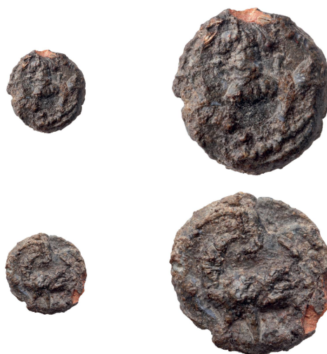
Abb. 6: Vorder- und Rückseite der Bleiplombe 5 (Inv. 1974.10235). Links: M. 1:1, rechts: M. 2:1.