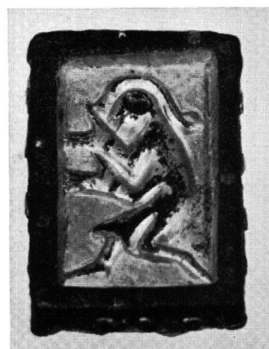
Tafel XV, Abb. 2. Germanisches reliefverziertes Beschlägstück aus Vindonissa (S. 104) Aus ASA 1938, Heft 2