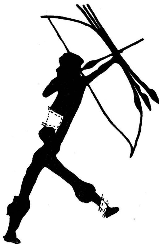
Abb. 40. Jäger mit einfachem Bogen Dunkelrote Felsmalerei aus der Valltorta- Schlucht (Provinz Castellón-Ostspanien) Verkleinert [Nach H. Obermaier und P. Wernert]

Daß die Jungpaläolithiker in der Tat über Bogen von verschiedener Form, teils einfach, teils zusammengesetzt, verfügten, bewiesen die Felsmalereien Ost-Spaniens (Abb. 40, 41).