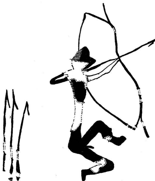
Abb. 41 Jäger mit zusammengesetztem Bogen Dunkelrote Felsmalerei aus Alpera (Provinz Albacete) Verkleinert