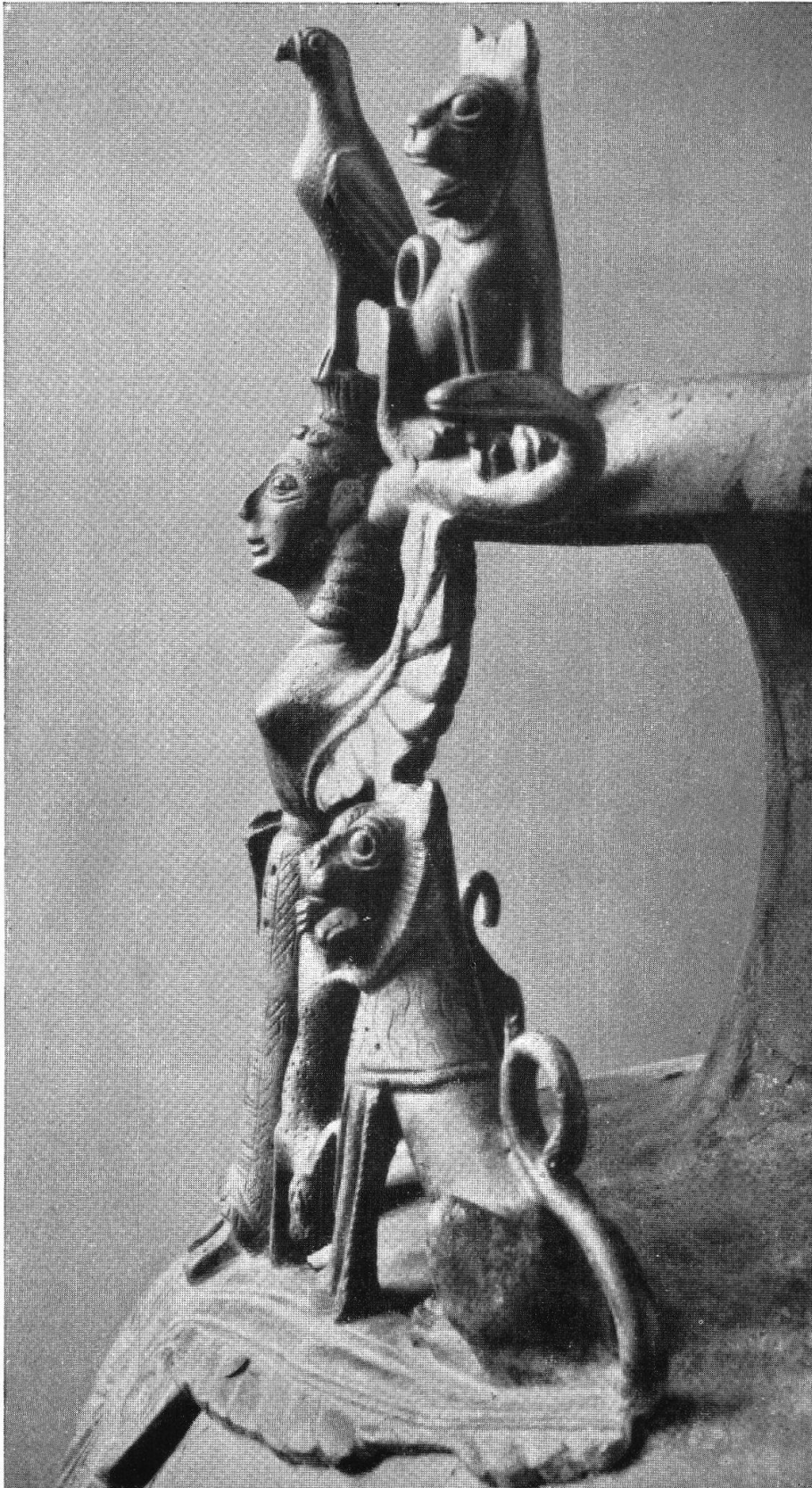
Tafel V. Seitenansicht des Henkelschmuckes der Hydria von Grächwil-Meikirch (S. 45) Aus H. Blösch, Ant. Kunst in der Schweiz, Zürich 1943