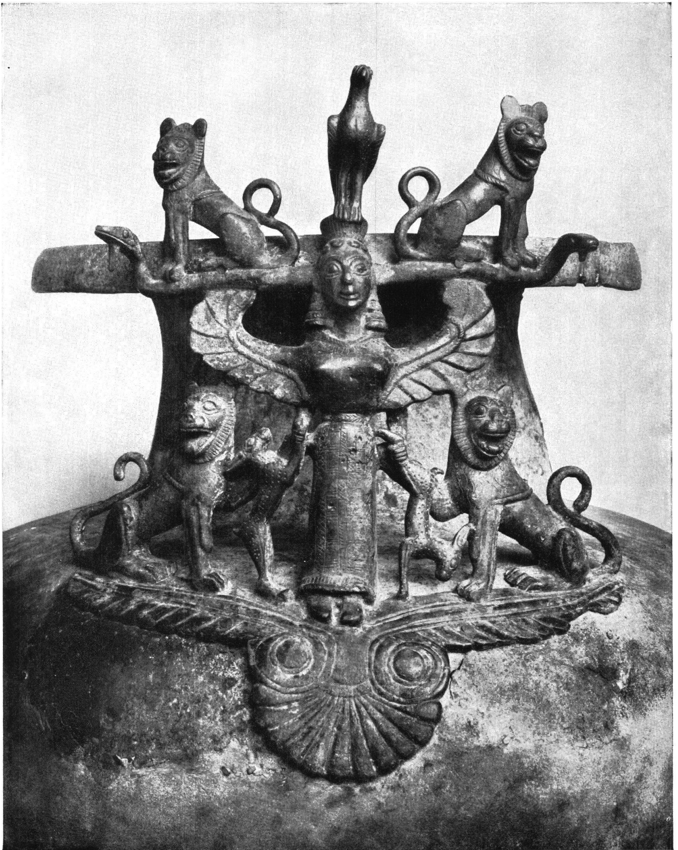
Tafel IV. Henkelschmuck der Hydria von Grächwil-Meikirch (S. 45) Aus H. Blösch, Ant. Kunst in der Schweiz, Zürich 1943