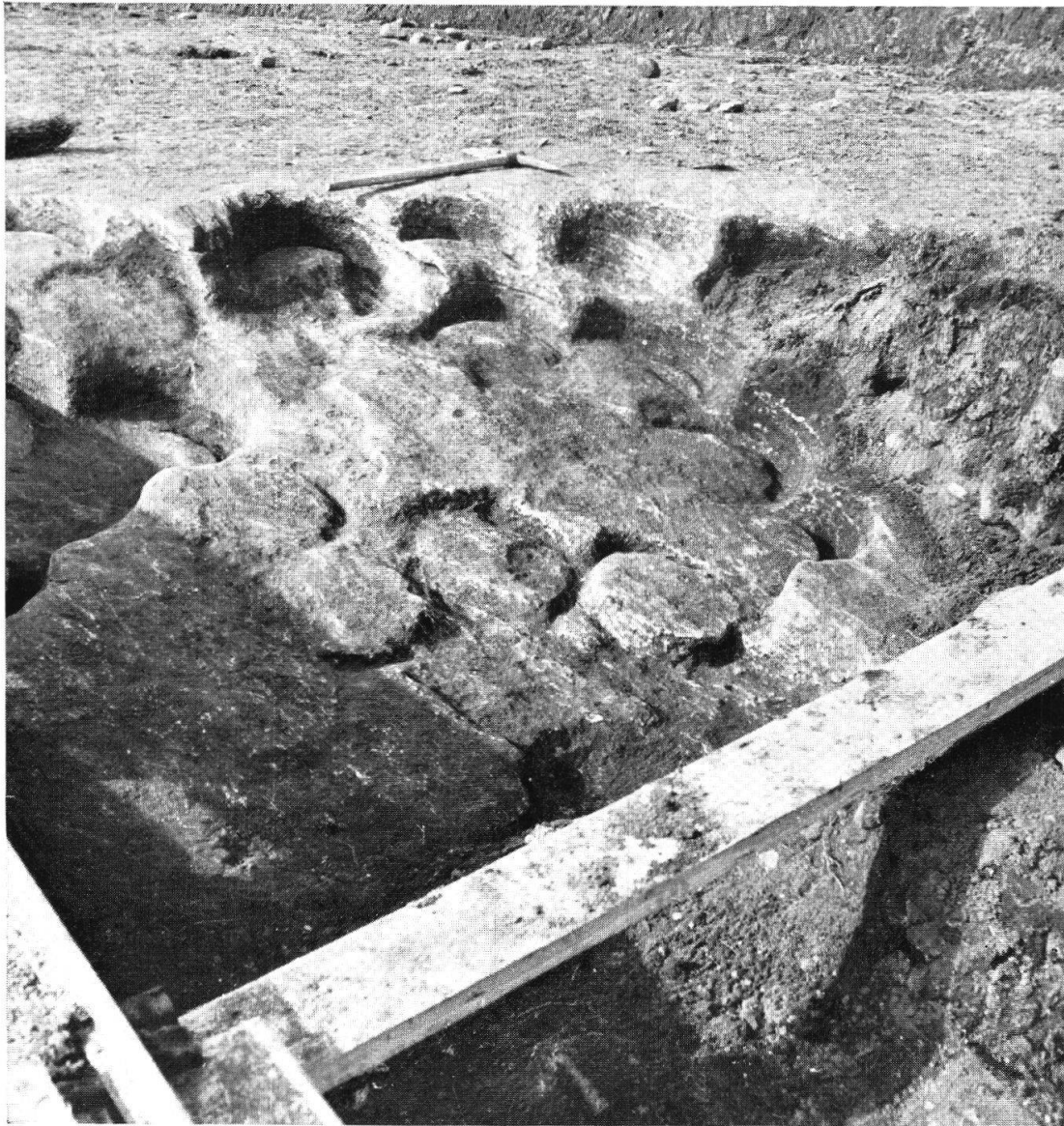
Tafel VIII, Abb. 1. Chavannes-le-Chêne. Carrière romaine (p. 71) Suisse primitive 1943.