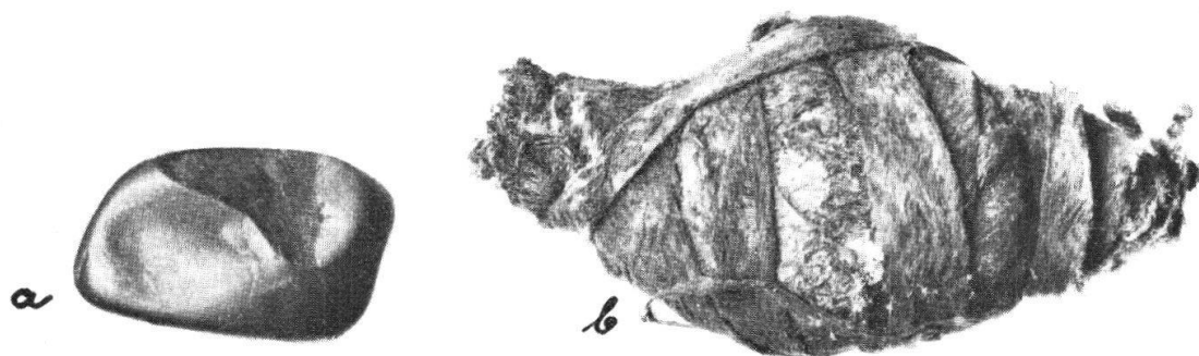
Tafel XXIII, Abb. 1

Steine für den Fruchtbarkeitszauber der Bundi auf Neuguinea. \frac{2}{3} Gr. Standort: Ethnograph. Sammlung der Universität Fribourg (Sammlung Höltker). a. Nackter Stein, Nr. 198, b. Eingewickelter Stein, Nr. 200 (S. 124)