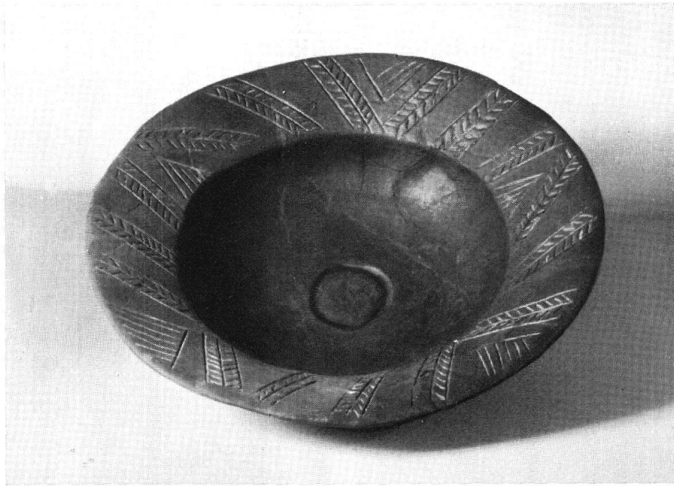
Taf. IX, Abb. 1. Sankert. Hemishofen (S. 56) Aus Jber. Mus.-Ver. Schaffhausen 1945