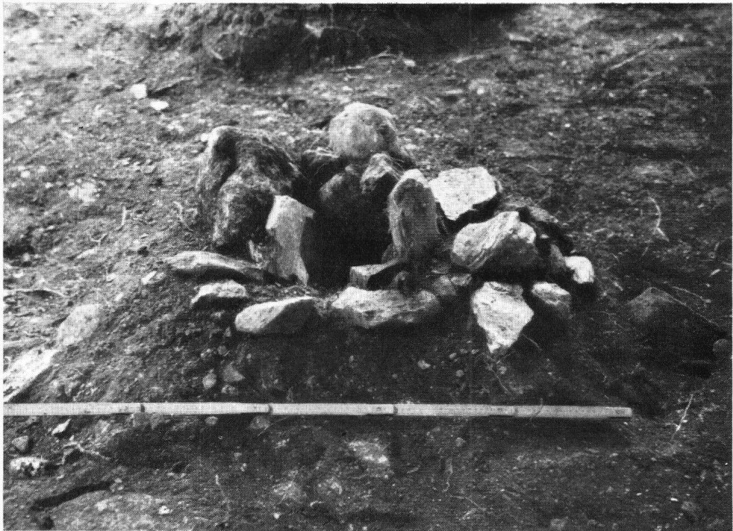
Tafel X, Abb. 1. Cazis-Cresta. Pfostenloch (S. 85) Aus Ur-Schweiz, Nr. 3, 1947