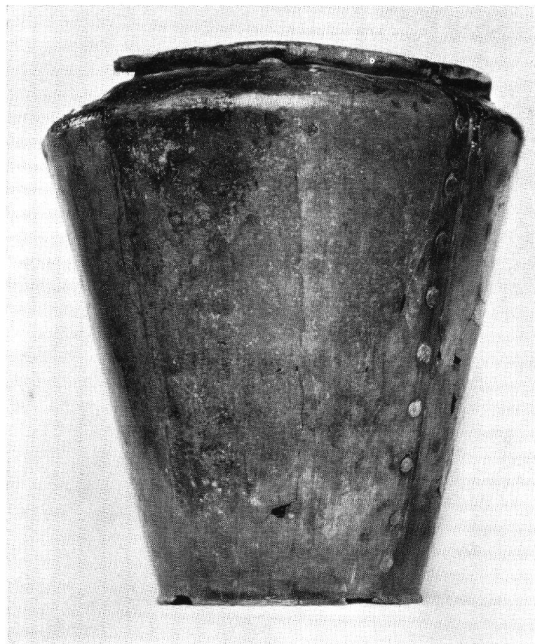
Tafel XIII, Abb. 2. Wohlensee-Hohbühl. Grabhügel II 1. Bronzeeimer in der Art des fragmentierten von Gunzwil-Adiswil (S. 117)