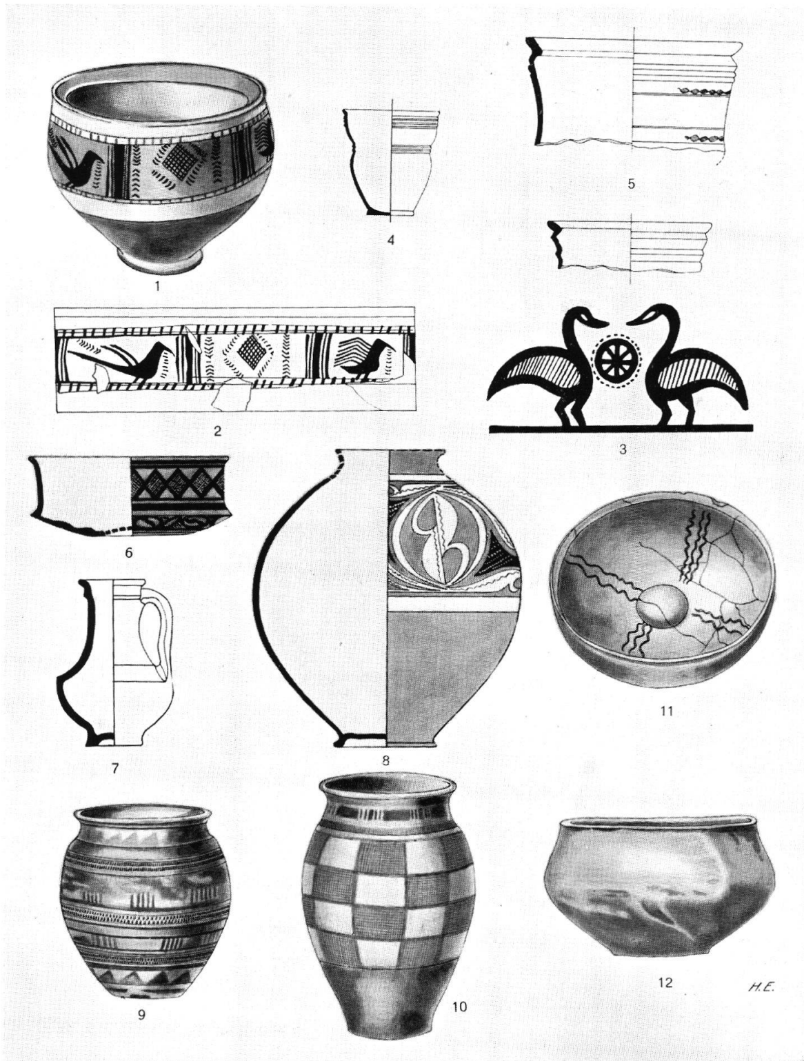
Taf. XXXV. Bemalte und unbemalte Latène-III-Gefäße aus schweizerischen und deutschen Fundstellen. 1, 2 Genf - Les Tranchées, bemalter Becher mit seltenem Vogelfries und dessen Abrollung, nach Cartier; 3 hallstädtische Vogeldarstellung auf einer geometrischen Vase Griechenlands, nach Roes; 4, 5 Augst, unbemalter Gurtbecher, nach Ettlinger; 6—8 Basel-Gasfabrik, bemalte Schale, unbemalter Henkelkrug, bemaltes Kugelgefäß, nach Major; 9 Mölsheim, bemaltes Prunkgefäß mit gezählter Doppelleiste, nach Behrens; 10 Osthofen, bemalte Urne, nach Behrens; 11, 12 Nauheim, Omphalosschale, Schüssel, unbemalt, nach Quilling. (S. 257—270)