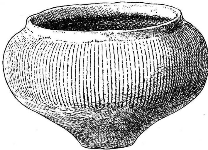
Abb. 36. Schaffhausen – Wolfsbuck. Kragenschüssel aus Grab 5