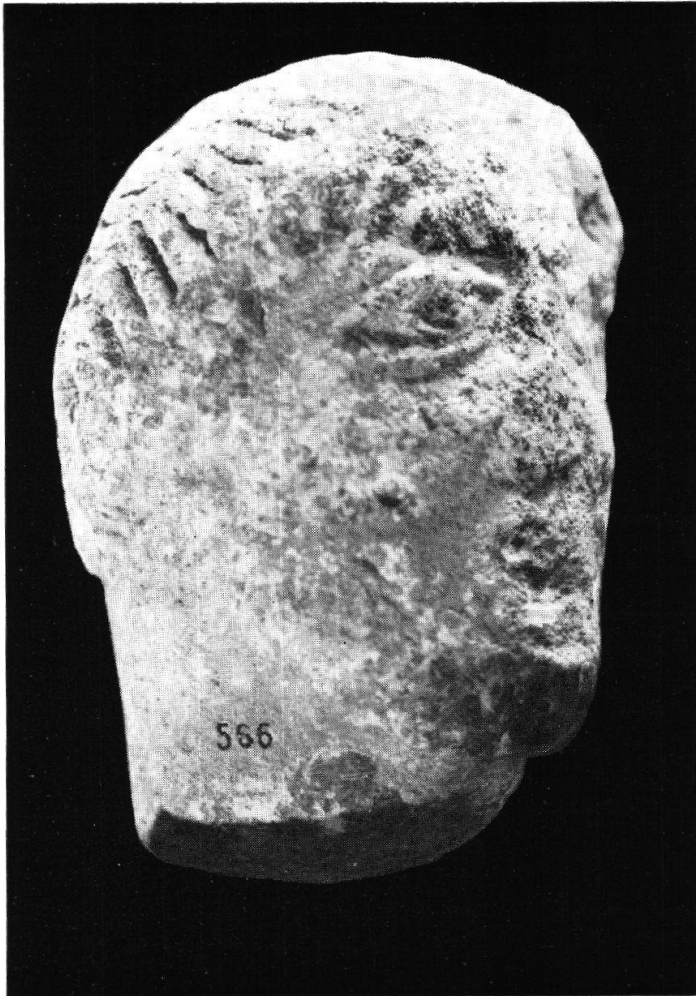
Pl. XII, fig. 1. Nyon. Tête virile (p. 108) Suisse prim., 1949