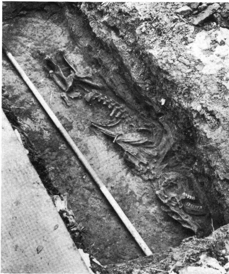
Taf. XIX, Abb. 1. Basel, Bernerring. Alamannisches Gräberfeld, Hirschgrab (S. 113)