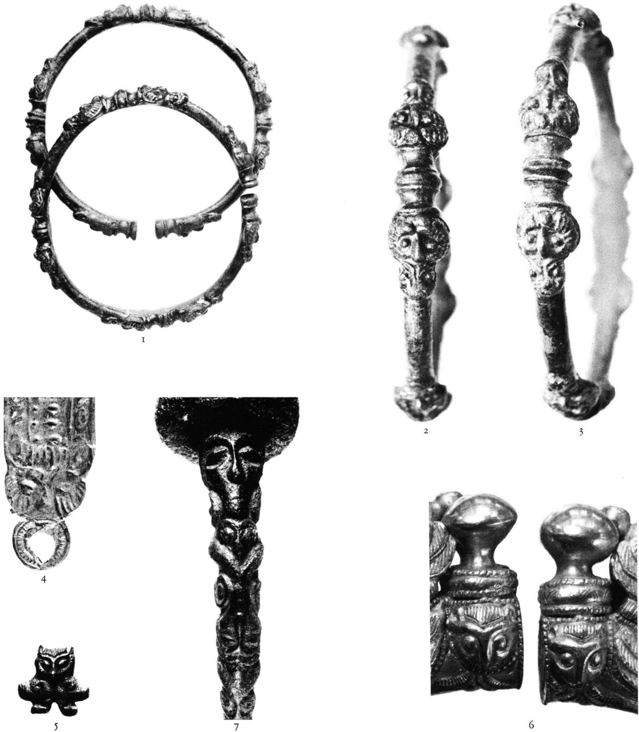
Planche 4. 1: Chandossel, FR, L'Enclose. Le paire de bracelets en bronze. 1:1. - 2 et 3: Détails des bracelets de Chandossel. Ca. 2:1.- 4: Bad Dürkheim (Kr. Neustadt). Détail du ruban en or. 2:1. - 5: Weiskirchen (Kr. Merzig-Wadern). Fragment de la fibule de bronze. 1:1. - 6: Rheinheim (Kr. St. Ingbert). Détail du bracelet en or. 3:1. - 7: Courtisols, «Les Closeaux de la Conge» (Dept. Marne). Tombe 11, détail du torques en bronze. Ca. 5:2. - Photos: 1-3: Musée d'Art et d'Histoire, Fribourg; 4: Museum der Pfalz, Speyer; 5: Landesmuseum, Trier; 6: Staatl. Konservatoramt, Saarbrücken; 7: Röm. German. Komm. Frankfurt a. M., E. Neuffer.