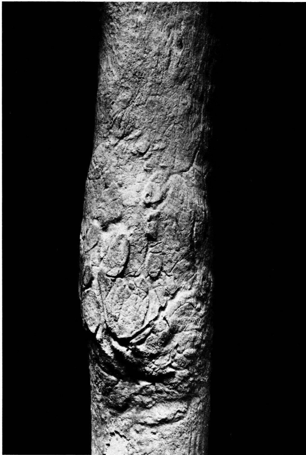
Abb. 3 Linker Femurschaft mit Osteoid-Osteom Individuum 33 (Streufund 4), natürliche Grösse

in der Tibia und im Femur vorkommt. Eine Metastase oder ein sogenanntes Osteoclastom sind sehr unwahrscheinlich.