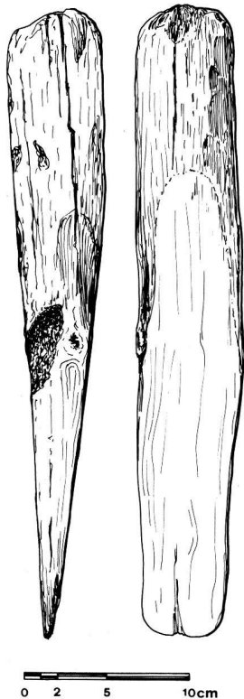
Fig. 27. Yverdon VD, St-Roch. Coin en chêne. Epoque de La Tène (?). Dessin M. Klausener.

Les pieux sont implantés à la cote 430.00 (plus ou moins 20 cm) dans un niveau de sables limoneux bruns, surmontant un mince niveau tourbeux, contenant de nombreux restes végétaux, des bois flottés