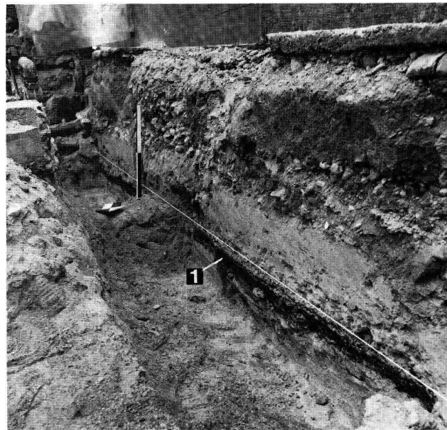
Abb. 1. Zug ZG, Vorstadt 26. Westprofil im uferparallelen Schnitt III. 1 = Horgener Kulturschicht.

An Funden erbrachte die obere Kulturschicht einige wenige Wandscherben und verschiedene Steingeräte, die zusammen mit den Altfinden (M. Itten, Die Horgener Kultur. 1970, Taf. 12) einer älteren Phase der Horgener Kultur zugewiesen werden können. Da beim Schichtab-