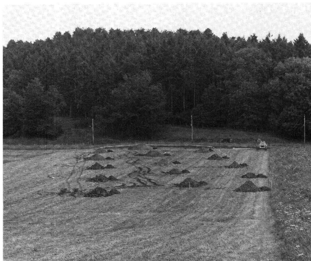
Fig. 1. Sondages systématiques sur le tracé de la Transjurane (N16), ici l'écart est de 20 m. Région de Courgenay-Paplemont JU. Photo C. Masserey.

Les travaux ont débuté en avril 1986 et c'est lors de la deuxième campagne de sondages, en mai 1987, que furent découvertes les traces évidentes d'une occupation romaine aux Montoyes. Il s'agit là, probablement, de la villa romaine mentionnée par A. Quiquerez, éminent chercheur jurassien au 19 e siècle. Malheureusement ses textes sont imprécis et avant les sondages archéologiques, il était impossible de déterminer l'emplacement exact de cette villa. Ce même auteur signale encore deux monnaies, un Antonin et un Constance II; un dépôt monétaire du 4 e siècle a également été découvert dans la région plus récemment. Mais, à nouveau, ces trouvailles ne sont pas localisées précisément.