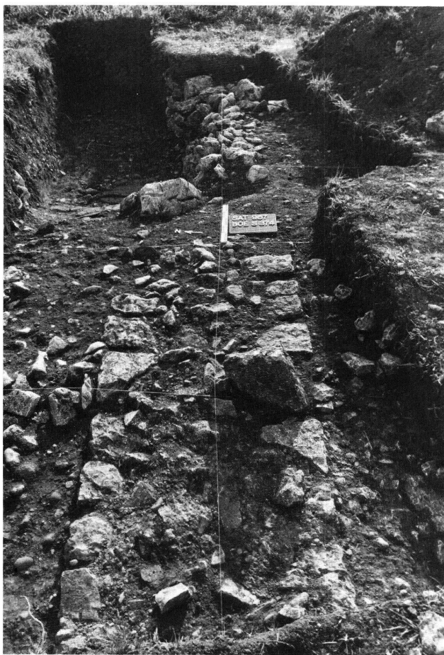
Fig. 2. Boécourt-Montoyes JU, occupation romaine. Base de mur; au premier plan l'appareil est encore complet, au fond le hérission est visible; longueur 5 m.