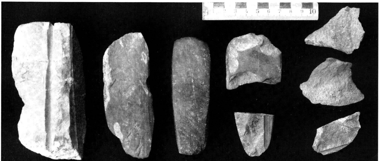
Abb. 2. Die Fundkategorien. Entsprechend dem Arbeitsfluss in der Beilherstellung kann zwischen fünf Fundkategorien unterschieden werden (von links nach rechts).

1. Rohlinge : Sie zeigen nur eine, höchstens zwei Bearbeitungsspuren, z.B. Anschliff zur Prüfung der Steinqualität oder den Sägeschnitt; aber noch ist keine Beilform festgelegt. Gänzlich unbearbeitetes Rohmaterial darf, mangels Beweis, nicht als ein Rohling betrachtet werden.