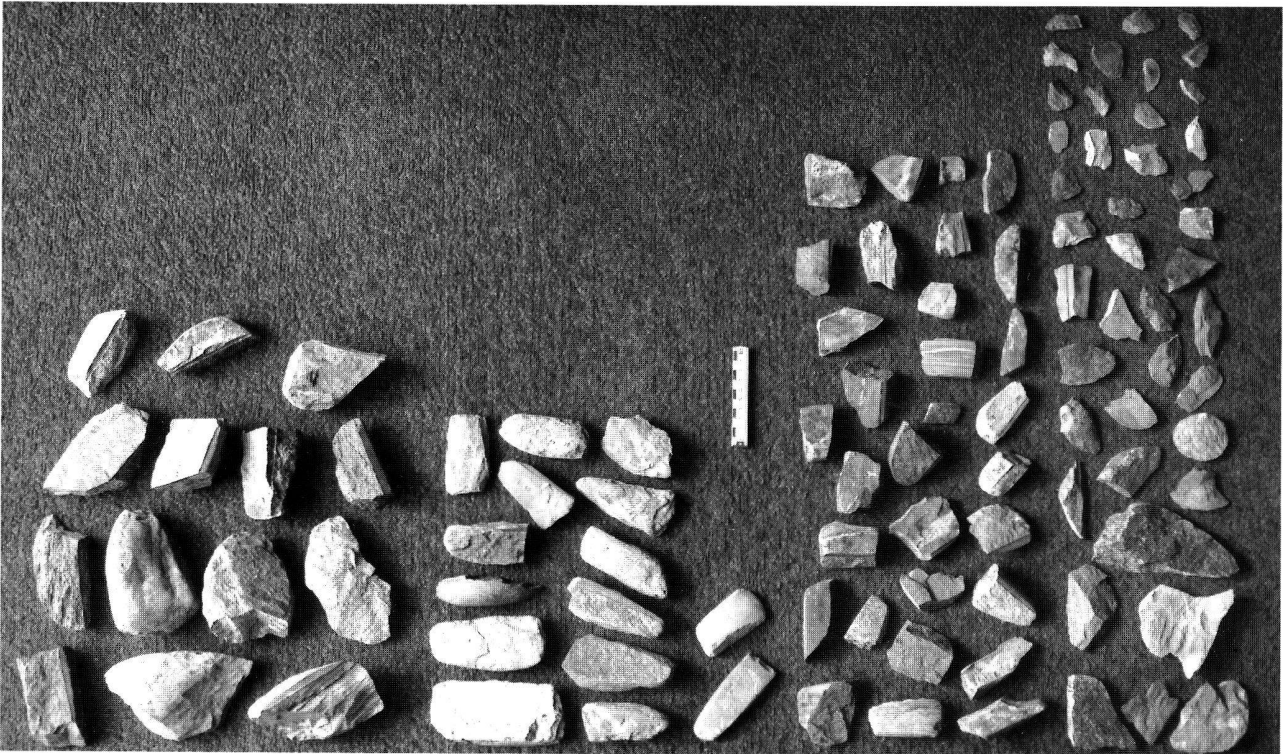
Abb. 1. Das Werkstattensemble vom Seegubel. Auf einer kleinen Fläche von 5 \times 10 m konnten auf dem Seegrund total 245 Funde geborgen werden. Bezeichnend ist, dass 24% der Steine aus Passstücken bestand, 46% Sägeschnittspuren aufwies und dass unbeschädigte Beilklingen an dieser Stelle fehlten. Die Foto zeigt 100 repräsentative Stücke, die im richtigen Verhältnis zueinander ausgewählt wurden und gemäss den fünf Fundkategorien angeordnet sind. Vergleiche auch die Abb. 2 und 3.