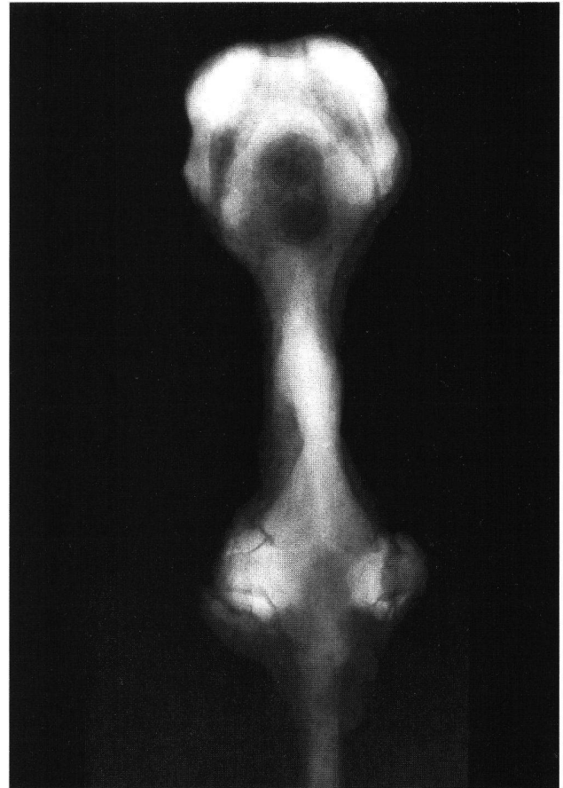
Abb. 3. Knollenknaufschwert im Historischen Museum St. Gallen. Röntgenaufnahme des Griffs.

kussionsgrundlage 11 . Das Schwertdepot befand sich in der Grabenauffüllung einer Befestigungsanlage, worin über und unter dem Depot campanische Ware der ersten Hälfte des 1. Jh. v. Chr. nachgewiesen werden konnte. Darauf folgt eine Schicht mit augusteischer Keramik. Falls eine sekundäre Fundverlagerung ausgeschlossen werden kann, wären die Knollenknaufschwerter demnach spätlatènezeitlich zu datieren 12 .