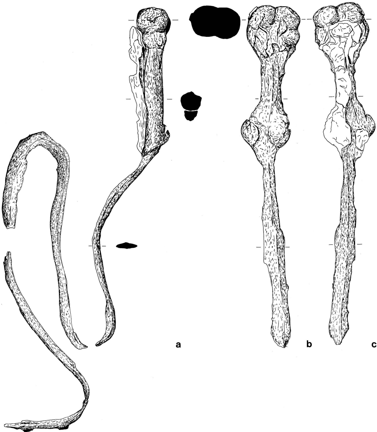
Abb. 1. Knollenknau Schwert im Historischen Museum St. Gallen. Fragmente in ihrer möglichen Zusammengehörigkeit, Seitenansicht (a) und die beiden Seiten des obersten Klingenteils mit Griff (b.c). M 1:2. Zeichnung P. Nagy.