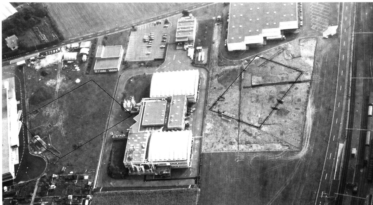
Fig. 8. Marin-Epagnier NE. Les deux enceintes laténiennes de Marin-Epagnier (septembre 1991). A gauche, celle des Bourguignonnes avec la partie centrale de son fossé nord-ouest en cours de fouille; à droite, celle de Chevalereux, totalement dégagée. Sur ce dernier site, toutes les anomalies observées lors du terrassement (donc aussi le fossé), ont été recouvertes par un plastique noir, empêchant le sol de sécher et la végétation de pousser jusqu'à la mise en chantier des fouilles. Une fois les machines de chantier parties, ces anomalies ont pu être observées à loisir et la moitié d'entre elles se sont révélées être des formations naturelles.