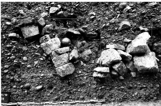
Abb. 7. Basel BS, Rittergasse 4. Querschnitt durch den Murus Gallicus (Ostschnitt 1991). Links die nach vorn gekippte Trockenmauer der Front, dahinter im Wallinnern eine Packung aus Kalkbruchsteinen, vermutlich zur Drainage. Unmittelbar hinter den obersten Steinen der Front wurde ein mittelalterliches Grab eingetieft (das Becken noch in situ ).

bis auf die unterste Lage abgetragen und anschliessend repariert worden. Die Reparatur erstreckt sich aber höchstens auf die vordersten zwei Meter des Walls, das Wallinnere ist nicht davon betroffen und besteht aus einer einzigen Phase, datierbar in die 2. Hälfte des 1. Jh. v. Chr.