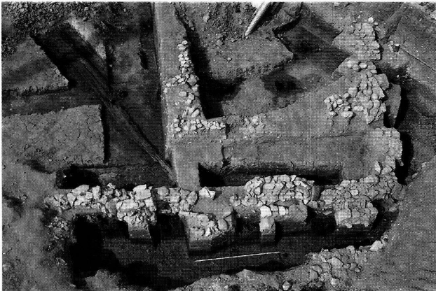
Fig. 10. Yverdon-les-Bains VD, rue des Philosophes 21. Angle sud-est du rempart celtique arasé.

sanne 1992) a connu un brusque rebondissement lors d'une fouille de sauvetage qui s'est déroulée sur le tracé présumé de cette fortification, à la rue des Philosophes 21. En effet, à cette occasion, le plan de l'ouvrage est apparu très clairement (fig. 10): le parement du mur, dont seule subsiste la première assise, est ponctué par de gros madriers distants d'env. 1.80 m d'axe en axe. Env. 4.20 m à l'arrière de ce dispositif, une seconde rangée de poteaux, parallèle à la première, fait vraisemblablement office d'armature interne comme cela a été mis en évidence au Mont Vully (FR). Tous les bois étaient de chêne et de section quadrangulaire (env. 0.50 × 0.20 m). Ils étaient conservés sur une hauteur variant de 0.20 à 0.70 m. Un des madriers, découvert lors des sondages, a d'ores et déjà pu être daté de l'automne/hiver 82/81 av.J.-C. (LRD, Moudon). Dans l'emprise de la fouille, le rempart forme un angle droit et se poursuit vers l'ouest en direction du castrum du Bas-Empire.