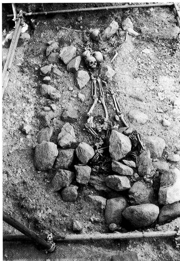
Fig. 6. Vue générale de la structure 4.A. Au premier plan, deux corps en connexion partiellement recouverts de blocs et au fond, les crânes correspondant aux inhumations précédentes.