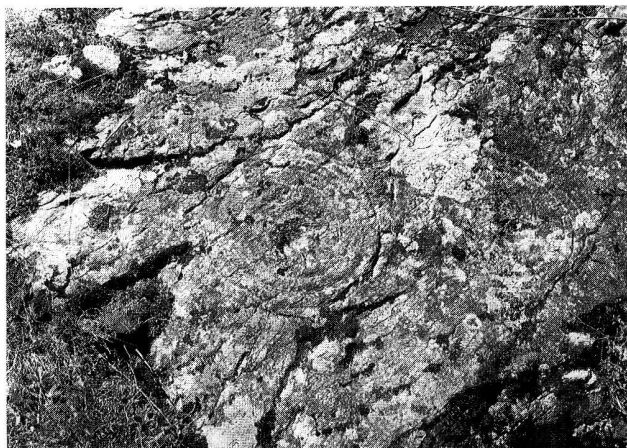
Abb. 5. Tinizong-Senslas GR; Felszeichnungen mit Schälchenmotiv und konzentrischen Kreisen.