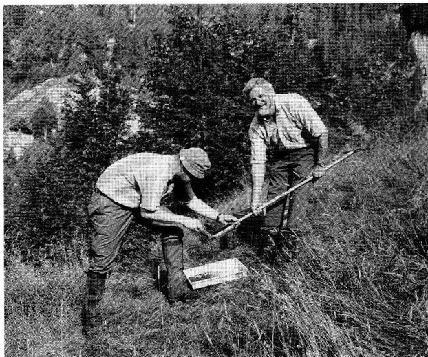
Fig. 2. Fusio, Mött d'Oréi. Prelievo di campioni di terreno con una trixella a mano.

Dalla datazione al radiocarbonio il carbone risulta risalire al periodo tardoromano (fig. 4, campione ⑤), cioè appena posteriore alla necropoli romana di Moghegno. E' così ipotizzabile un piccolo insediamento sulla collina a sud di Fusio risalente alla tarda epoca romana.