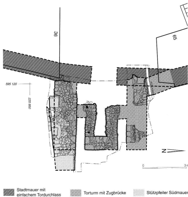
Abb. 37. Büren a.A. BE, Rütitor. Befund und Rekonstruktion. Plan ADBE.

Chevenez JU, Combe en Vaillard voir Age du Fer