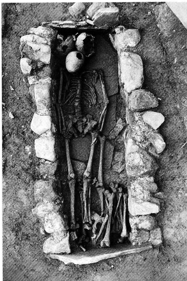
Fig. 40. Pully VD, chemin Davel 16. Tombe à murets maçonnés T44.

SAC FR, G. Bourgarel, P. Jaton et P. Cogné.