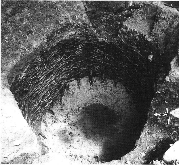
Abb. 43. Stein am Rhein SH, Bürgerasyl. Einer der schönsten Befunde als Beispiel für die ausgezeichneten Erhaltungsbedingungen: Latrinegrube G24 mit Flechtwerk.