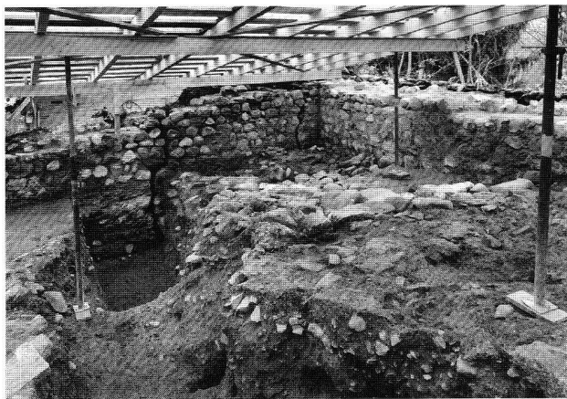
Abb. 38. Gams SG, Burg. Blick in die Südostecke des Burghofes. Gut sichtbar die zwei durchgehenden Risse in der Ostmauer.

ritaine, ce bâtiment est agrandi en direction de l'est, dans l'espace vide donnant sur la Sarine. Cet immeuble ne semble pas avoir été réuni aux autres avant le 16 e s., lors du couvrement de sa cave et de la reconstruction de la façade sur rue à l'emplacement actuel. Enfin, signalons la découverte d'un plafond peint du 16 e ou 17 e s. au sud du premier étage.