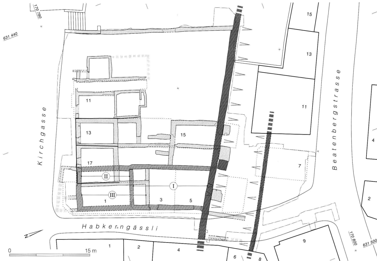
Abb. 45. Unterseen BE, Ostabschluss. Übersicht der Hauptbautetappen. Dunkler Raster: Stadtbefestigung; mittlerer Raster: Kernbauten; heller Raster: jüngere Bauphasen. Plan ADB.