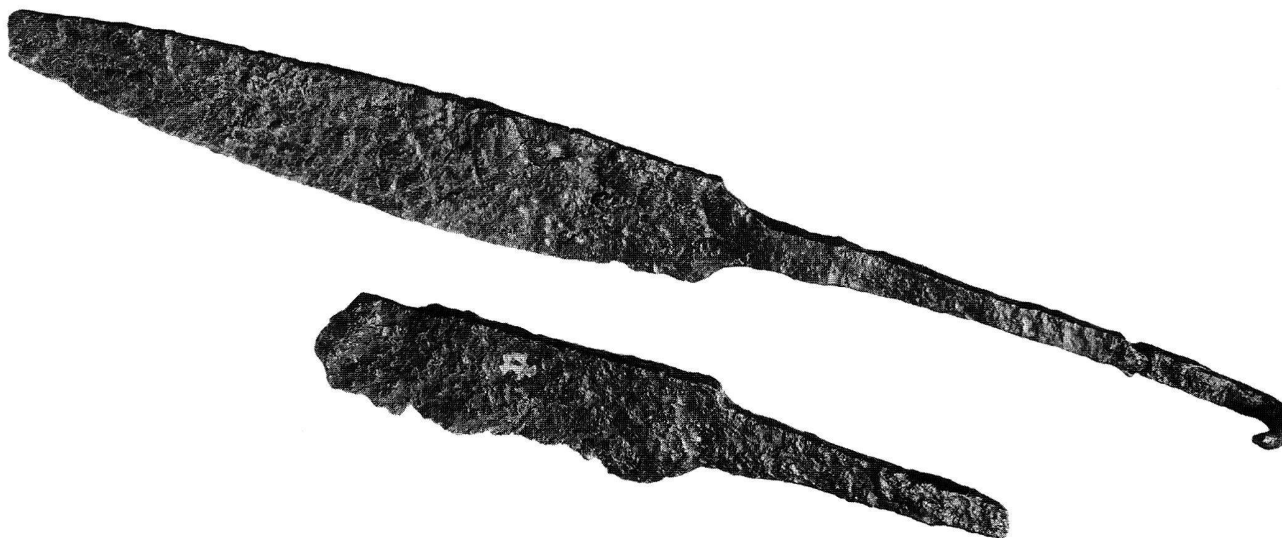
Fig. 39. Onnens VD, Le Motti. Lames de couteau dont l'une porte une lettre damasquinée. Fin du Moyen-Age. Longueurs 22,7 cm. et 12,3 cm.

plafonds actuels. Des investigations complémentaires seront nécessaires lors des travaux pour répondre à cette question.