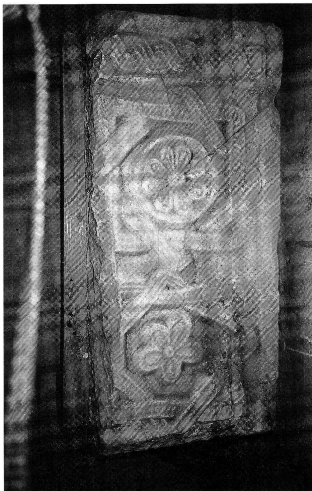
Fig. 36. Ascona TI, Chiesa dei Santi Fabiano e Sebastiano. Il frammento di transenna al momento del ritrovamento. Foto UBC-D.C.

Ufficio protezione beni culturali TI, R. Cardani Vergani.