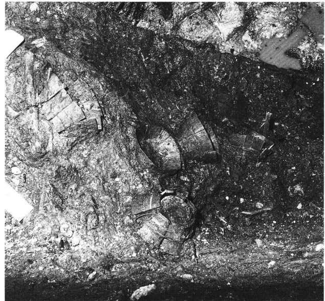
Abb. 44. Stein am Rhein SH, Bürgerasyl. Kleiner Ausschnitt der rund 50 geborgenen, praktisch vollständigen Daubengefässe aus der Verfüllung von G24.

deutlich viel organisches Material erhalten hat, nebst vielen Holzabfällen (z.B. Dachschindeln), Obstkernen und verrotten Pflanzenresten auch ein fast vollständig erhaltener Kinderschuh aus Leder und hölzerne Daubengefässe. Die Latrine ist durch Keramikfragmente in die Zeit um 1200 zu datieren.