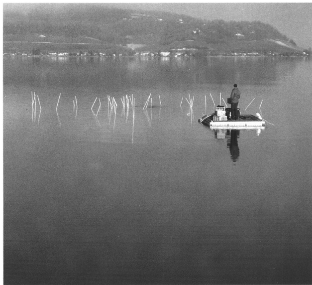
Fig. 2. Murten FR, Panschau. Marqueurs signalant les pieux de la station néolithique.

Der prähistorische Horizont wird nebst den Funden durch Steinstreunungen, HolzkohleKonzentrationen und Lehmlinsen charakterisiert. Letztere stellen die Überreste von Gebäuden dar. Für die