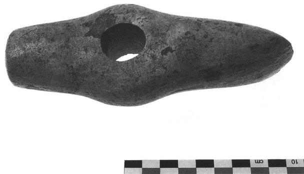
Abb. 4. Wangen b. Olten SO, Chrüz matt. Die 16 cm lange Lochaxt, wohl aus schnurkeramischer Zeit.