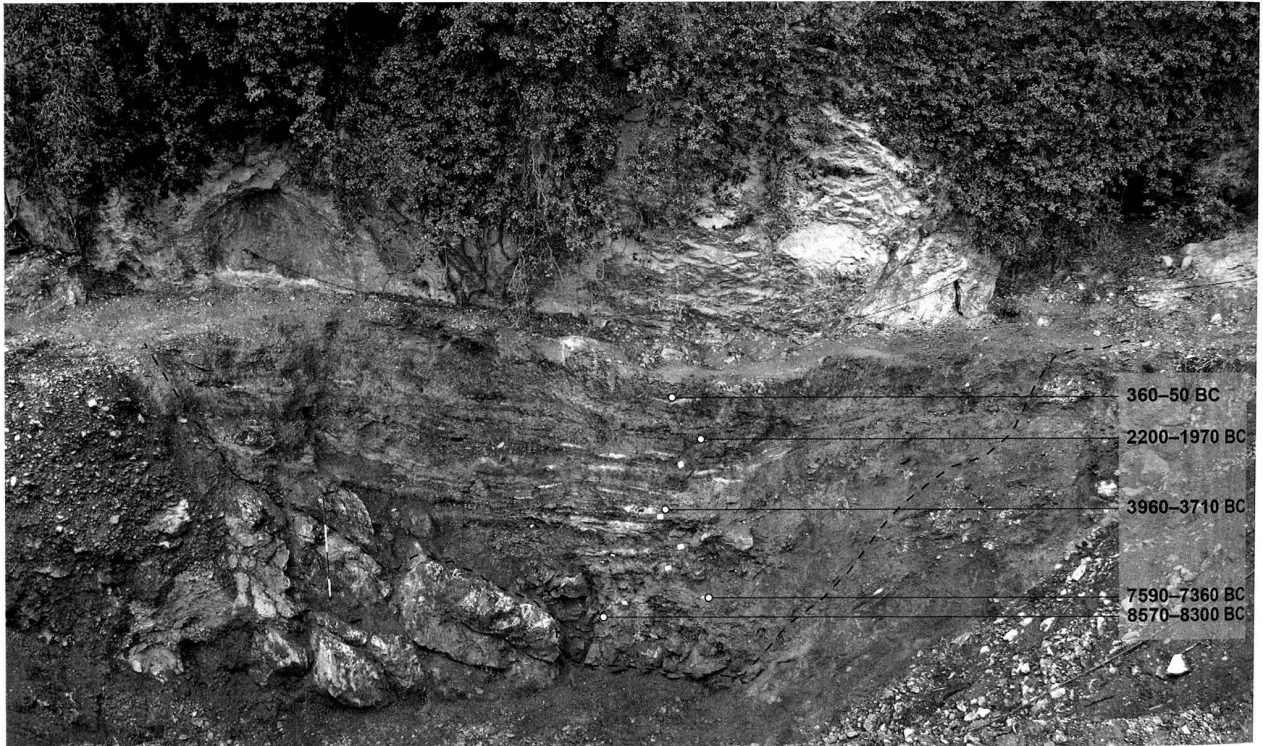
Abb. 4. Oberriet, SG, Unterkobel. Profilsicht der Fundstelle vor Beginn der Ausgrabung. Die unterbrochene Linie markiert die Ausdehnung der archäologischen Schichten, rechts im Bild sind die kalibrierten C14-Datierungen (2 sigma-Bereich) eingetragen.

chen Felswand des Kapf, im Gelände der Bauschuttdeponie Unterkobel, archäologische Schichten angeschnitten. Am 4.5.2011 wurde die Fundstelle von Spallo Kolb aus Widnau als archäologische Fundstelle erkannt und umgehend der KA SG gemeldet. Bei ersten Begehungen wurde das grosse Potential der rund 4.5 m hohen Stratigrafie mit zahlreichen Asche- und Holzkohleschichten schnell deutlich (Abb. 4). Nach verschiedenen Arbeiten (u.a. Sprengungen) zur Sicherung eines Teils der angrenzenden Felswand wurde am 25.7.2011 eine Grabung im zentralen Bereich des Abris begonnen. Dank der Unterstützung der Betreiber der Deponie Robert König AG (Peter und Roger Dietsche; Palmerio Zaru) konnte die Grabung in den Deponiebetrieb in der unmittelbaren Umgebung der Fundstelle integriert werden.