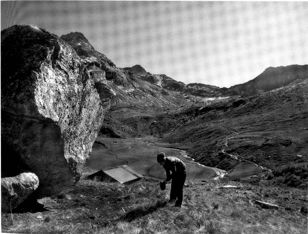
Abb. 2 Binn VS, Felsblock mit der Hochebene Blatt im Hintergrund (Hügel 2110).

Eine genaue Datierung des Oberflächenfundes ist anhand der typologischen Merkmale nicht möglich. Das bohrer- oder kratzerähnliche Gerät kann sowohl mesolithisch als auch neolithisch oder gar bronzezeitlich sein.