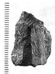
Abb. 3. Muotathal SZ, Hinter Silberen. Ölquarzitgerät. Länge 2,45 cm.

Im Winter 2011 wurden bei Baggerarbeiten am Fuss der westli-