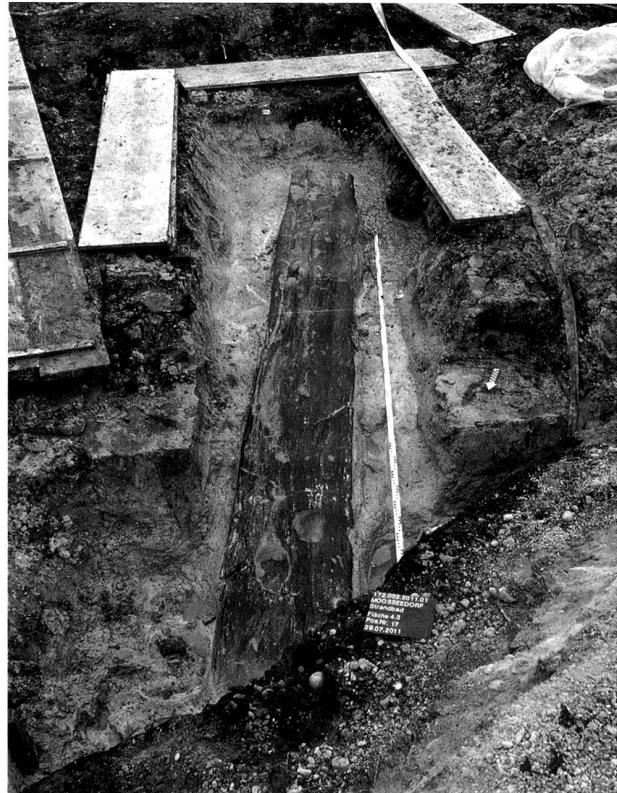
Abb. 6. Moosseedorf BE, Moosseedorf-Ost, Strandbad. Einbaum nach der Freilegung.

Im Herbst 2011 wurde im Rahmen des Interreg IV-Projekts «Erosion und Denkmalschutz im Bodensee und Zürichsee» eine seit längerem geplante Schutzmassnahme im Bereich der Ufersiedlung Steckborn-Schanz durchgeführt. Vor den Schüttungsarbeiten wurden auf einer Fläche von 210 m 2 auf dem Seegrund liegende Funde quadratmeterweise aufgelesen. Dabei handelte es sich vorwiegend um Gefässkeramik, die besonders bei Niederwasserstand im Winter durch den Wellenschlag aus den Kulturschichten ausgespült wurde. Die Objekte bestätigen somit das sukzessive Aberodieren der Siedlungsschichten. Weiter wurden vorgängig durch die Arbeitsgemeinschaft Bodenseeufer (AGBU) und das Institut für Seenforschung (LUBW) intensive ökologische und physikalische Untersuchungen durchgeführt.