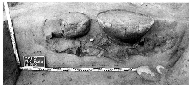
Abb. 7. Basel BS, Utengasse 15/17 (2011/21). Spätestbronzezeitliche Grube mit Tongefässen. Die Objekte wurden beim Bau der Industrieanlage im 19. Jh. gekappt.

Beim Abbruch der Gebäude und ihrer Fundamente kamen interessante industriearchäologische Befunde zum Vorschein, wie das Fundament eines Hochkamins, eines zugehörigen unterirdischen Rauchkanals sowie ein Sodbrunnen (oder Abwasserschacht?). Die Befunde lagen auf einer starken Schicht von Schwemmléhm bzw. -sand. Die Trennung des Aushubmaterials führte zur sorgfältigen Freilegung des genannten Lehms – ein Glücksfall, zeichneten sich darin doch Gruben ab, von denen zumindest die eine zwei oben abgeschnittene Tongefässe zu enthalten schien. Allerdings hatte nicht der Baggerführer die Grube gekappt, sondern bereits die